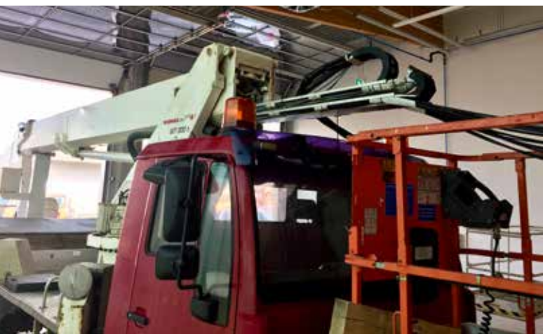
... wie das Arbeiten ...

Ergänzt wird das Serviceangebot durch zwei weitere Dienstleistungen. Zum einen verfügt das Unternehmen über einen mobilen Service, der im gesamten süddeutschen Raum bis ins Saarland und Hessen zum Einsatz kommt. Dabei steht ein voll ausgestatteter Servicebus bereit. Ferner bietet der Hubarbeitsbüh-