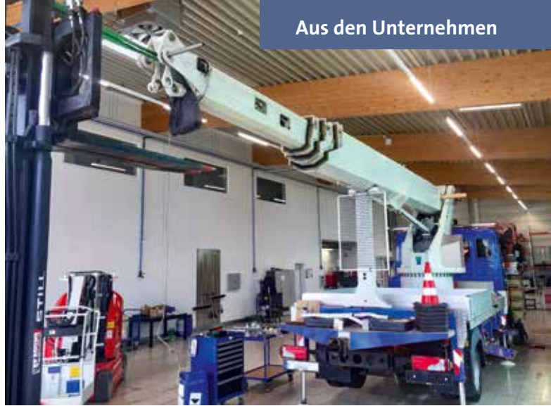
Auch der Wechsel von Teleskopen ist für ...