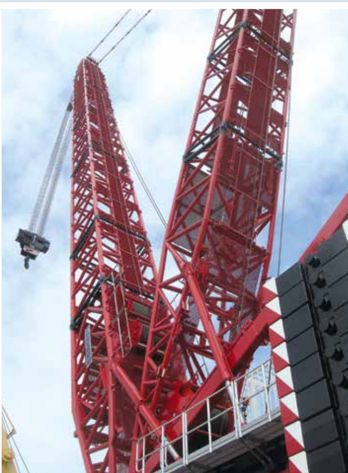
in der Kategorie Technik.