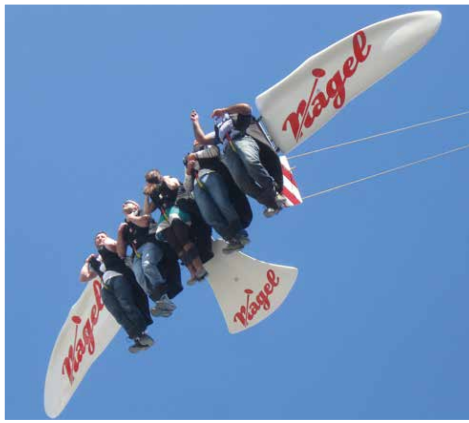
in der Kategorie Stimmung.