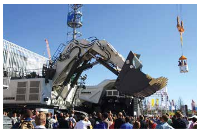
in der Kategorie Technik.