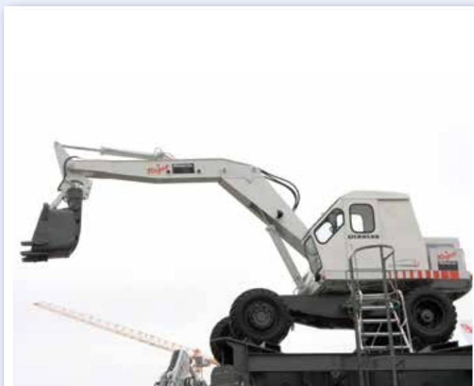
in der Kategorie Stimmung.