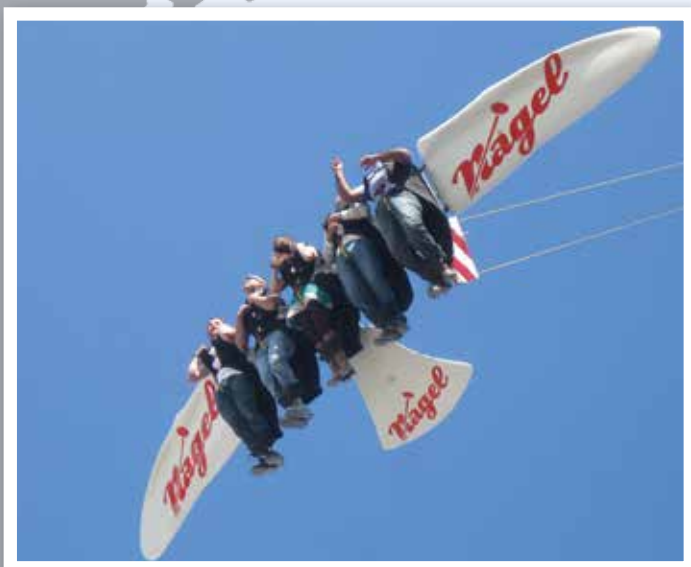
in der Kategorie Stimmung.