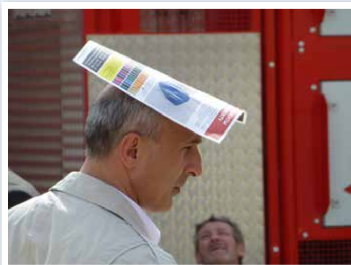
in der Kategorie Stimmung.