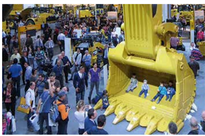
in der Kategorie Stimmung.