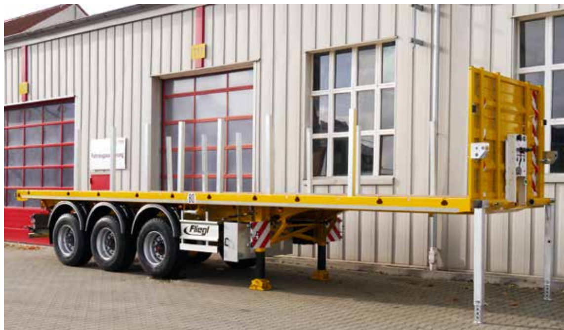
Mit den Plateaufliegern SDS 460 liefert Fliegl Trailer leistungsstarke Nutzfahrzeuge, die beim Kontergewichtstransport viel auf sich nehmen.

Im Stand unterstützen je zwei ausziehbare Klappstützen die 24 t-Stützwinde. Sie sind vor der Stahlstirnwand montiert, die etwa 1.000 mm hoch und mit zwei zusätzlichen Mittelstützen versehen ist. Immer die erste der drei