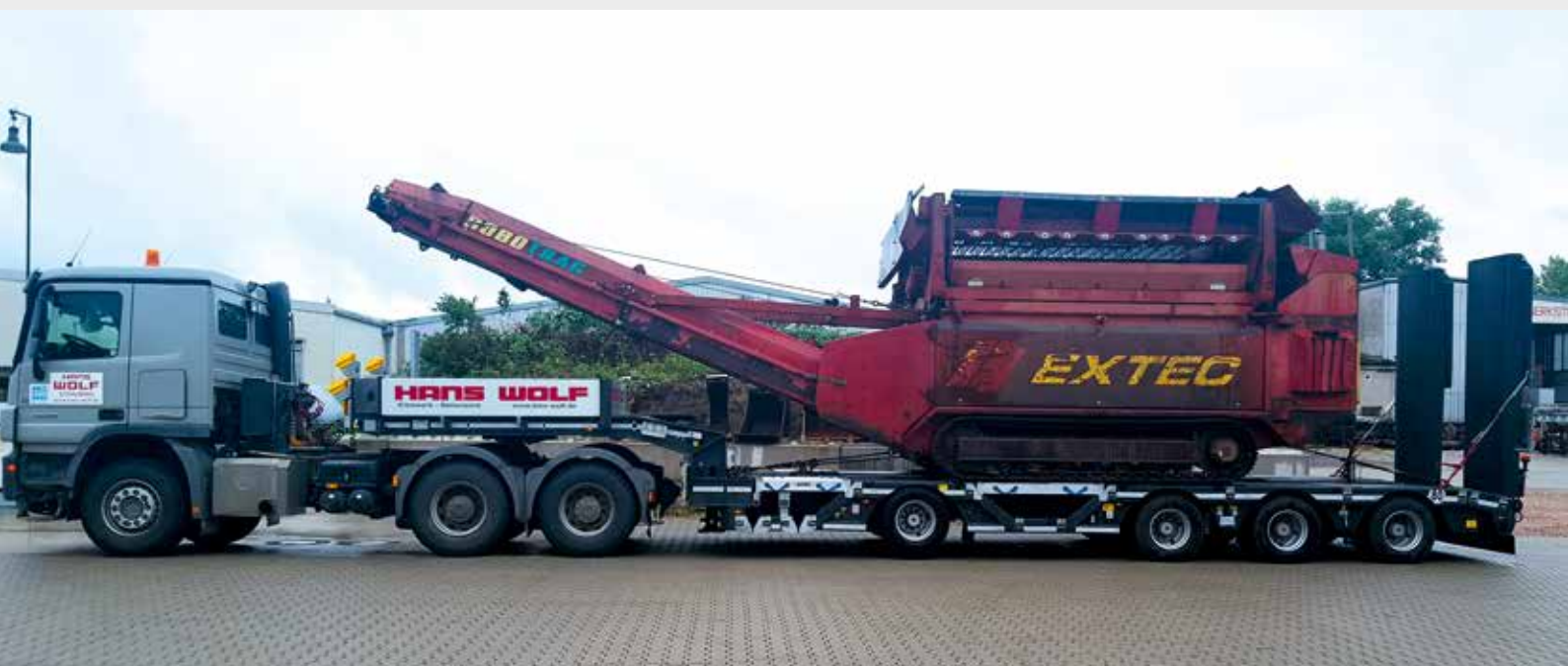
... investierte die Hans Wolf Transporte und Recycling GmbH in teleskopierbaren 4-Achs- MultiMAX von Faymonville.