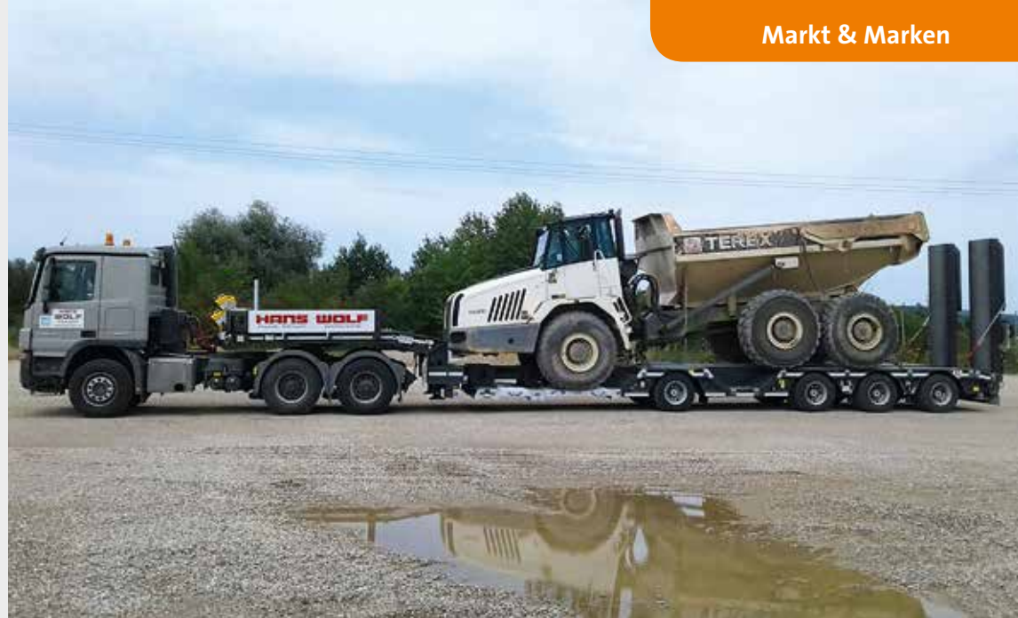
Auch schweres Gerät, wie dieser Terex Dumper, lässt sich mit dem MuliMAX transportieren.