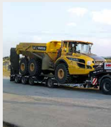
Für den Transport unterschiedlichster Baumaschinen ...