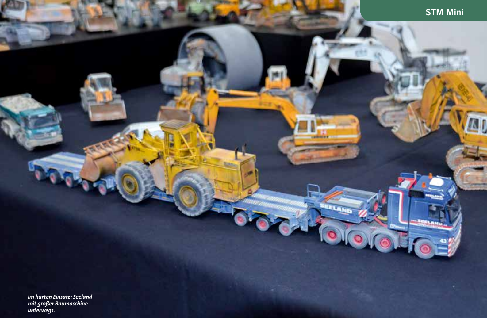
Im harten Einsatz: Seeland mit großer Baumaschine unterwegs.

Aus Italien brachten die Modellbauer diverse Turmdrehkrane und Schnellläufer mit, des Weiteren Baugeräte mit Amphibien-Kettenfahrgestell, wie im vergangenen Jahr auf der bauma in München im Original präsentiert.