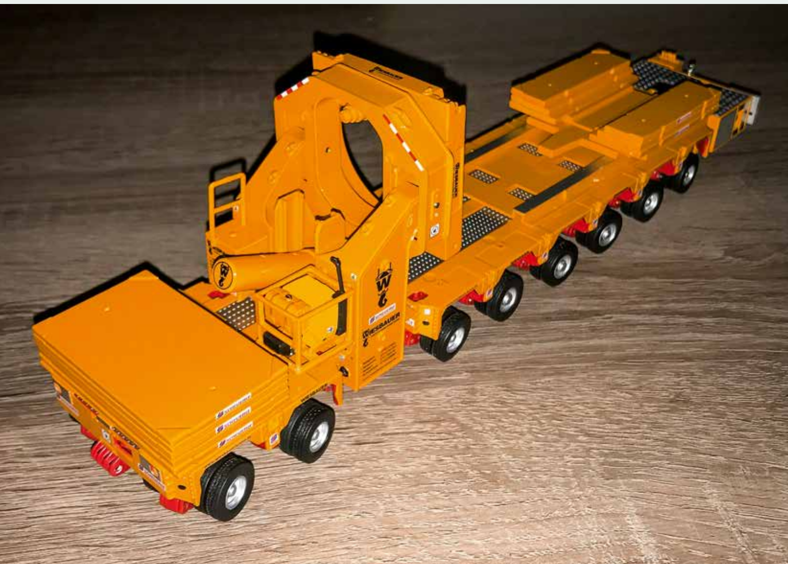
Auf den ersten beiden Achslinien liegt ein starres Gegengewicht auf, dann folgt der eigentliche Rotorblattadapter.