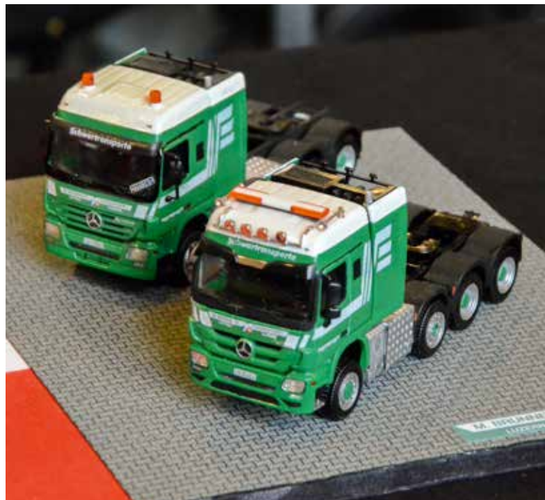
Im Doppelpack: zwei MB-Schwerlastzugmaschinen des Schweizer Schwertransportunternehmens Martin Brunner Transport AG mit Hauptsitz in Luzern.