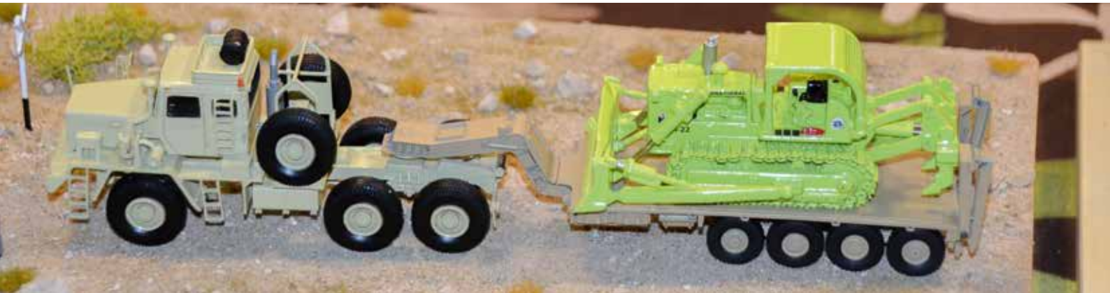
Die Senn AG aus dem schweizerischen Oftringen diente hier aus Vorbild.