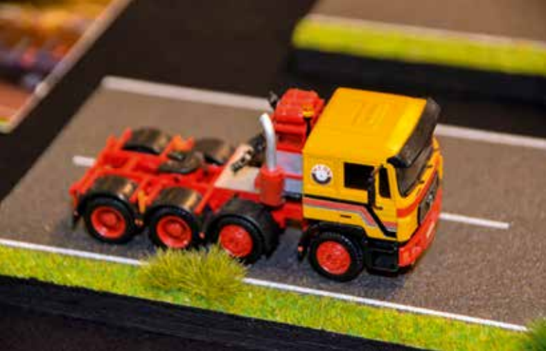
Auch Oldie-Liebhaber kamen in Mainz-Kastel auf ihre Kosten.