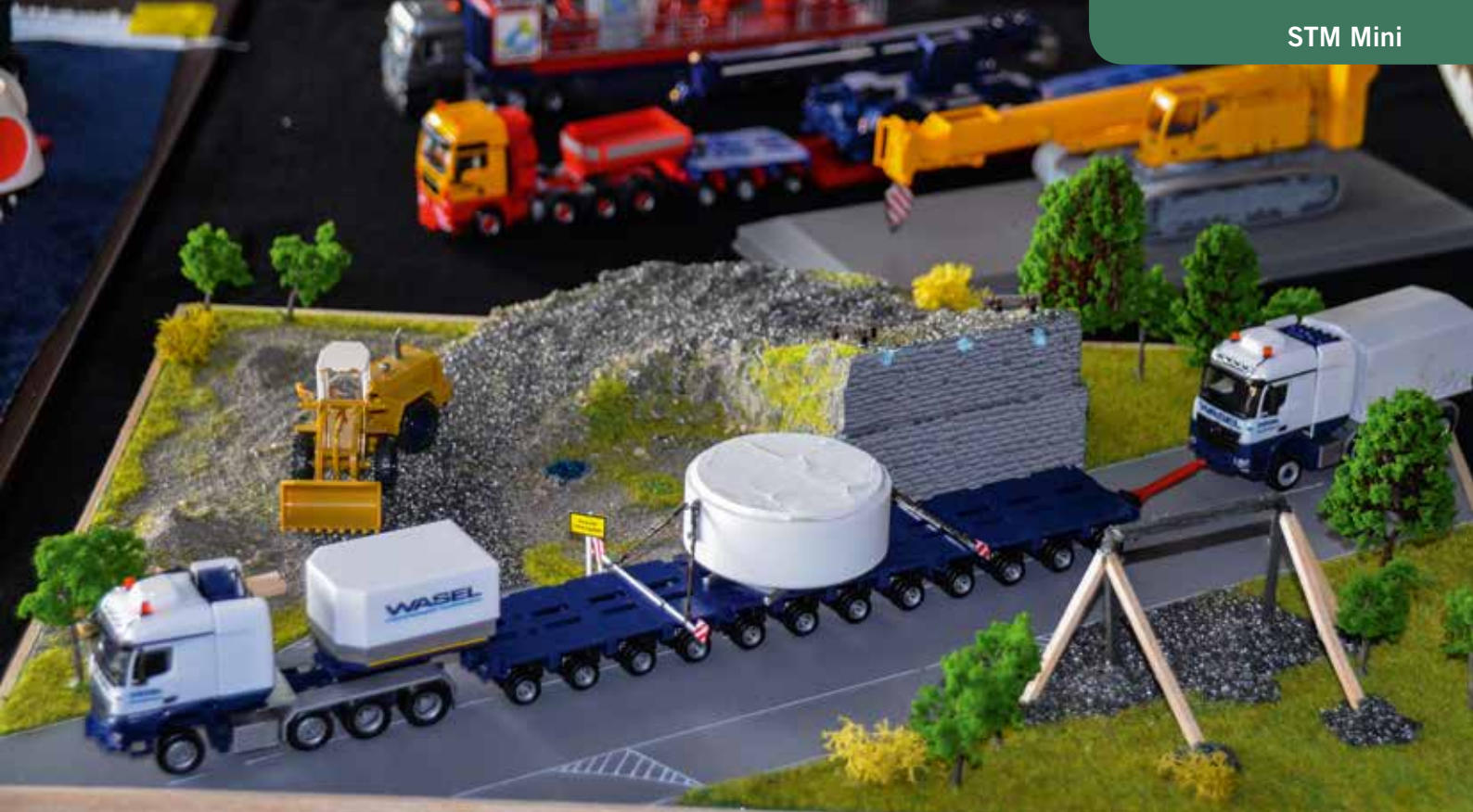
Im Zug-Schubverband ist dieser Wasel-Schwertransport unterwegs.