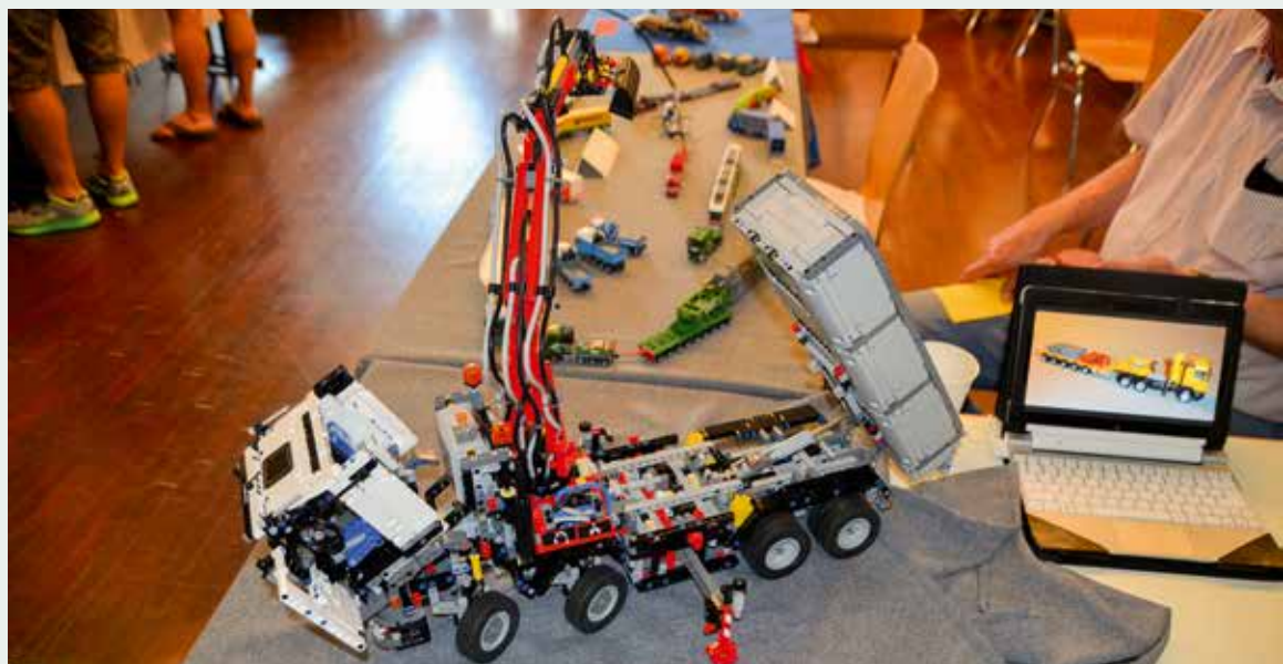
Umfangreich ausgestattetes Legomodell mit Ladekran, Kipper, Versorgungsleitungen, Rundumleuchten und und und ...