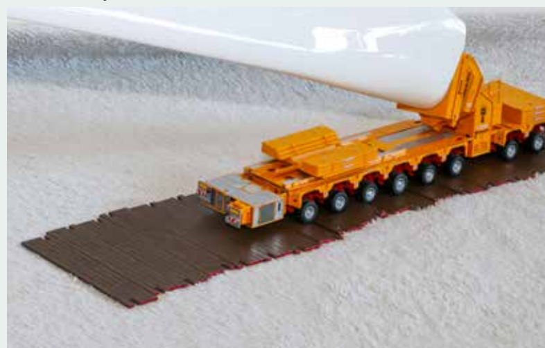
Ebenfalls von der Firma IMC stammen die unter dem Modell befindlichen Baggermatten.