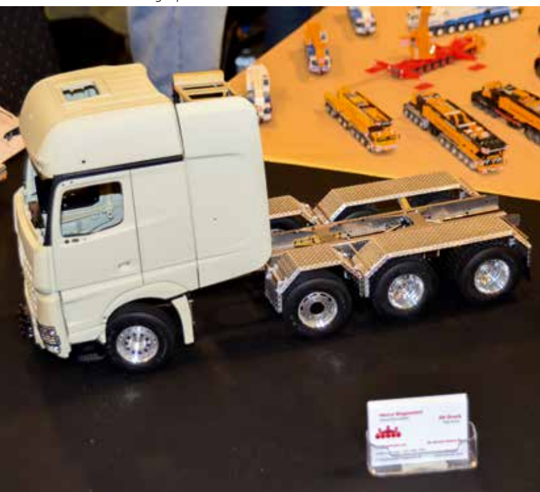
Arocs Schwerlastzugmaschine. Auch im Modellbau hat der 3D-Druck Einzug gehalten.