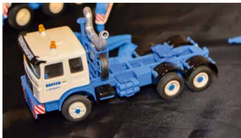
Zurück in alte Breuer-Zeiten versetzte die Besucher diese 3-Achs-Zugmaschine.