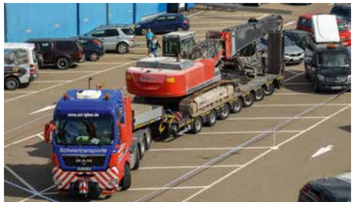
Nahm die Besucher draußen gebührend in Empfang: dieser Schwertransport samt Begleitfahrzeug.

Nachdem die Besucher draußen die Originale trotz des kühlen Herbstwetters ausgiebig unter die Lupe genommen hatten, ging es im Innern des Auto- und Technik Museum nicht weniger spannend weiter.