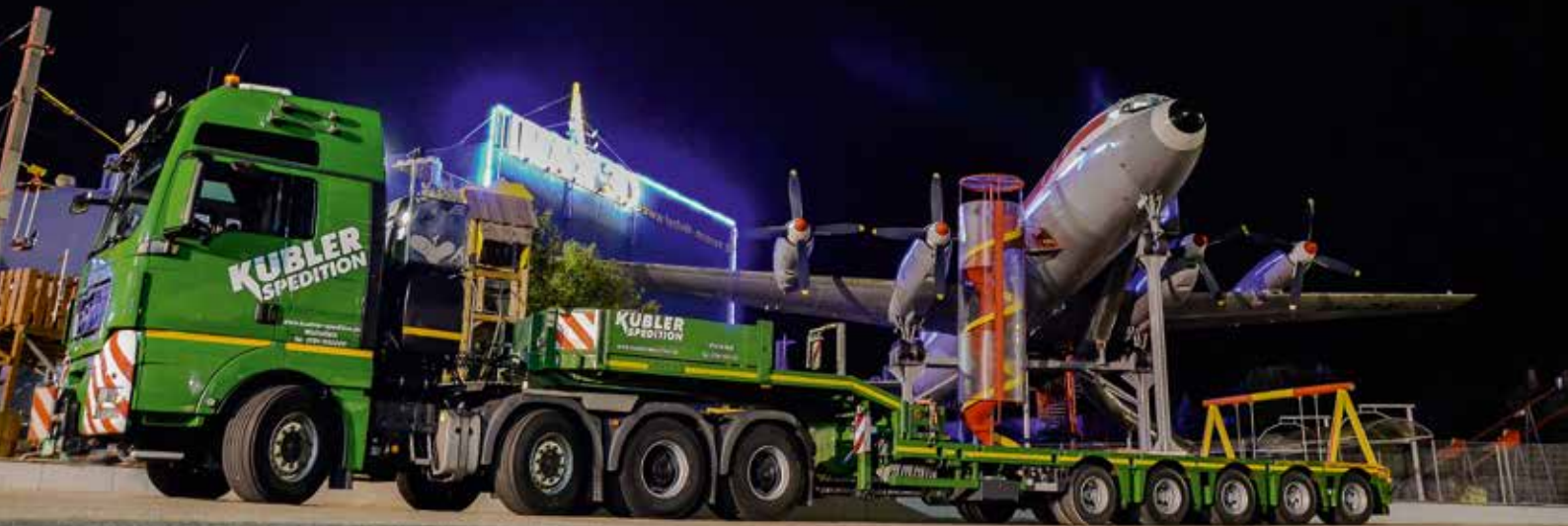
Auch diese Kombi von Kübler stimmte schon draußen auf die Mini Bauma ein.

Am 9. und 10. September 2017 fand zum 22. Mal die Modellausstellung Mini Bauma der IGFBK im Auto- und Technik Museum Sinsheim statt.