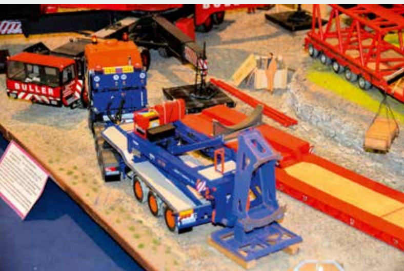
Fehlt eigentlich nur noch der Windkraftturm, der die beiden Teile der mit Turmadapter ausgerüsteten Fahrzeugkombi von Universal Transport verbindet. Und für die Zugmaschine gilt: auch ein schöner Rücken kann entzücken!