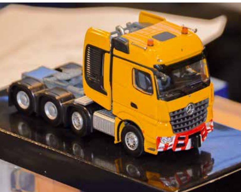
Den MB Arcos SLT gab es auf der Mini Bauma in diversen Variationen zu sehen.

Mit rund 80 Ausstellern, darunter erstmals Aussteller aus Italien sowie aus Frankreich, Österreich, Holland und Rumänien kam die Ausstellung in diesem Jahr nicht ohne zusätzlichen Platzbedarf, den man in der Lokhalle fand, aus. Selbst ein Besucher aus China wurde durch seinen deutschen Kontakt auf die Ausstellung aufmerksam und verbrachte dann sogar zwei Tage in Sinsheim.