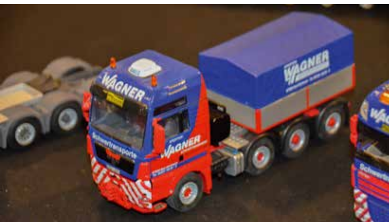
Dieser 4-achsigen MAN-Schwerlastzugmaschine in Wagner-Farben wurde auch eine Waeco Klimaanlage spendiert.