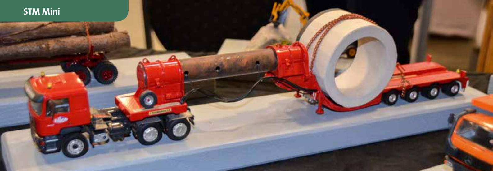
Sehr kreativer Schwertransport. Den hat selbst die STM-Redaktion noch nicht auf der Straße gesehen ...