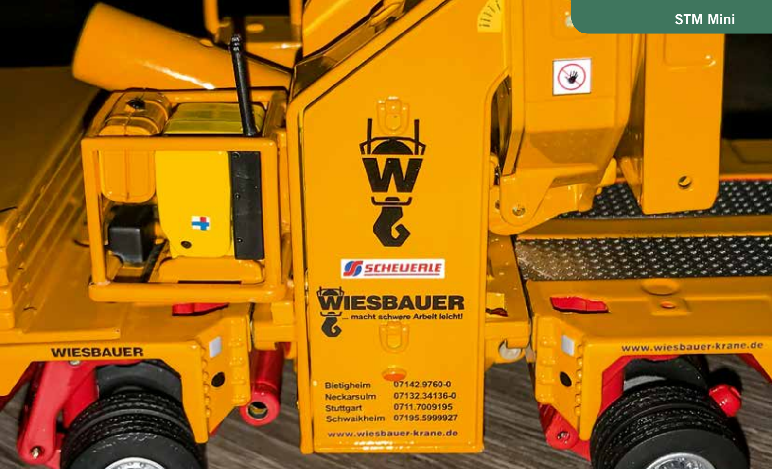
Lackierung und Beschriftung sind dem originalen Fahrzeug von Wiesbauer nachempfunden.