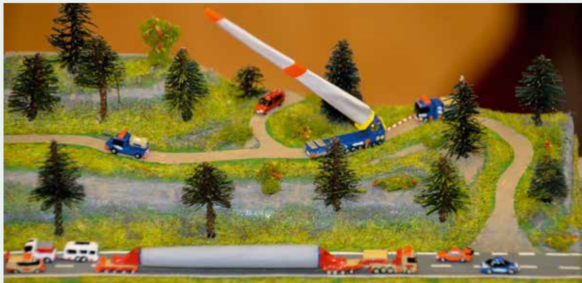
Ganz schön klein: Windkrafttransporte im Maßstab 1:700.