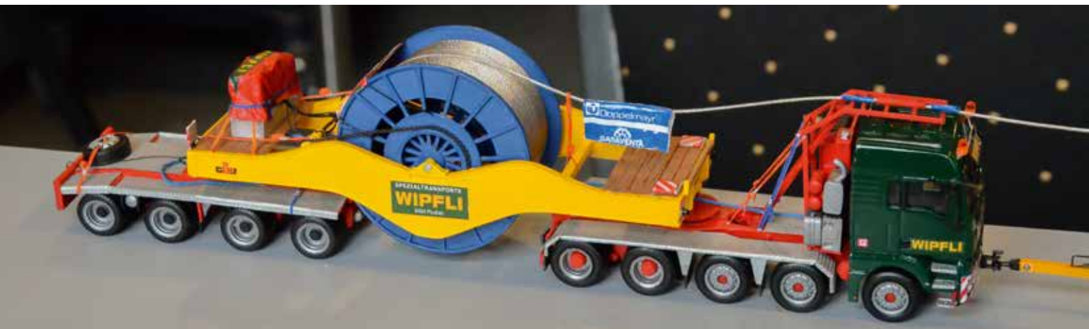
Im Schwertransportmagazin Nr. 77 berichteten wir über diesen Einsatz, den das Schweizer Unternehmen Feldmann für die neue Eibsee-Seilbahn durchführte ...