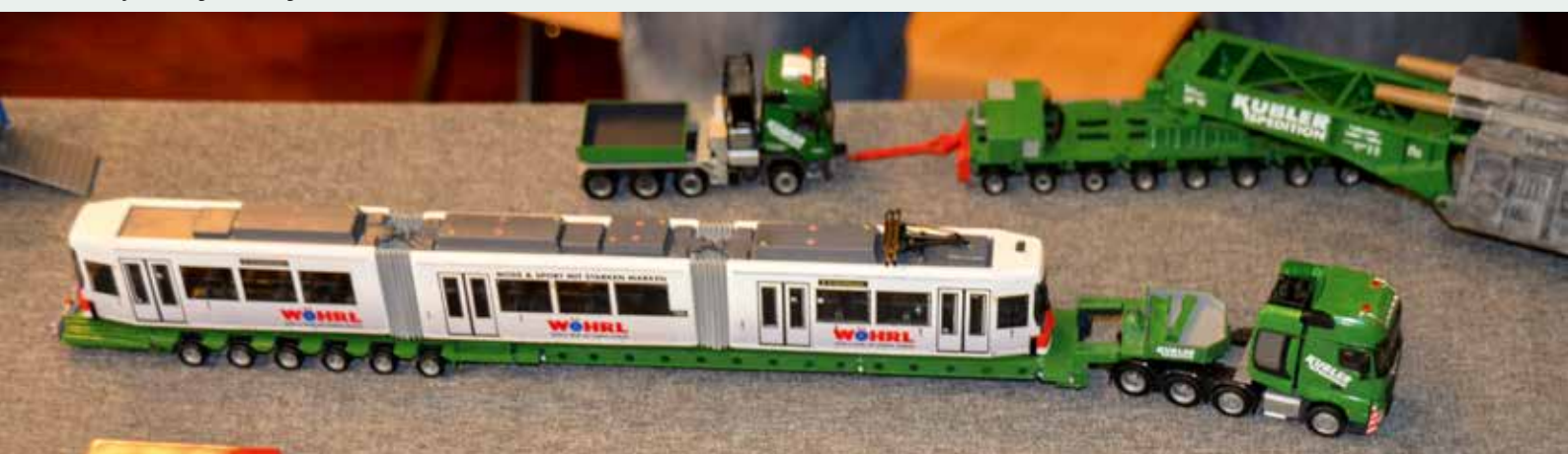
Und nochmals das Thema Transport von Schienenfahrzeugen. Hier ist Kübler mit einer Straßenbahn unterwegs. Im Hintergrund Transport eines Trafos im Tragschnabel.