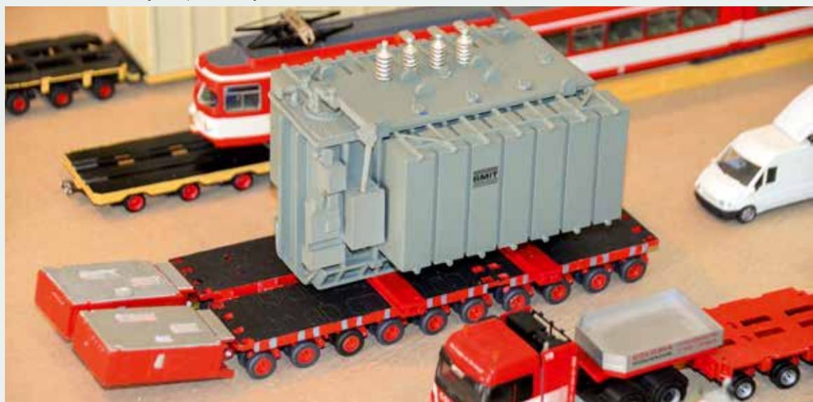
Vorne Colonia-Schwerlastkombi und Trafotransport auf Selbstfahrem. Im Hintergrund unter anderem Transport eines Schienenfahrzeugs. Die Lackierung der gezeigten Transportfahrzeuge lässt dabei Viktor Baumann als Spediteur vermuten.