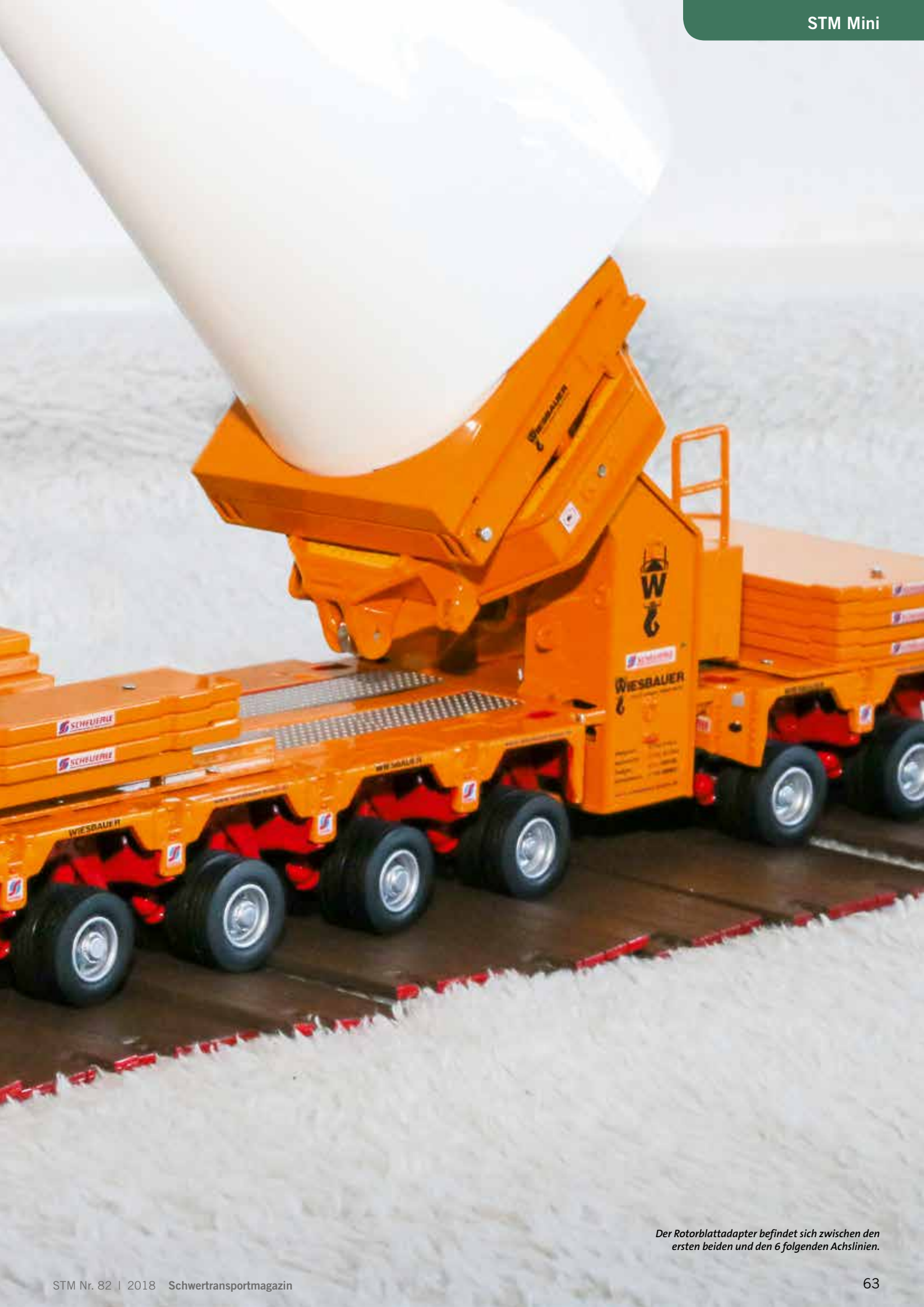
Der Rotorblattadapter befindet sich zwischen den ersten beiden und den 6 folgenden Achslinien.