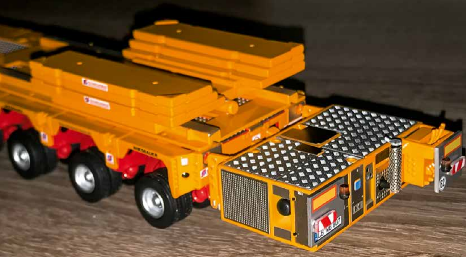
Powerpack und verfahrbare Gegengewichte.