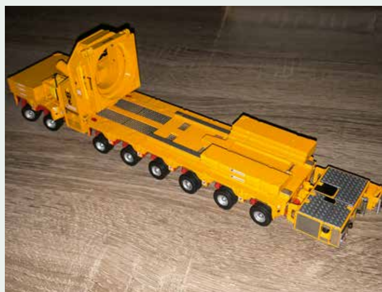
Dass Modell ist auf 250 Stück limitiert.