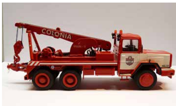
Historischer Abschleppwagen auf Magirus-Deutz: nachgebaut von Willi Euskirchen.