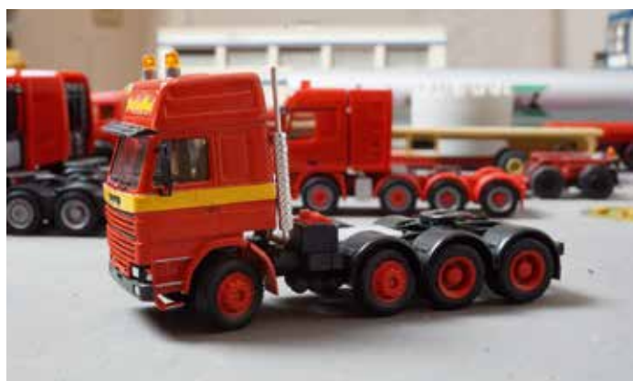
Scania-4-Achs-Zugmaschine im Maßstab 1:87 von Helmut Stiegler.