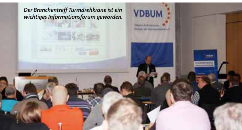
Der Branchentreff Turmdrehkrane ist ein wichtiges Informationsforum geworden.

als Gleich unter anderem dar. Er verdeutlichte den Unterschied zwischen den fahrzeugbezogenen Sondergenehmigungen nach der Straßenverkehrszulassungsordnung (StVZO, §§ 13 und 70) sowie den streckenbezogenen Ausnahmegenehmigungen der Straßenverkehrsordnung (StVO, §§ 29 und 46, Dauer- und Einzelfahrgenehmigungen).