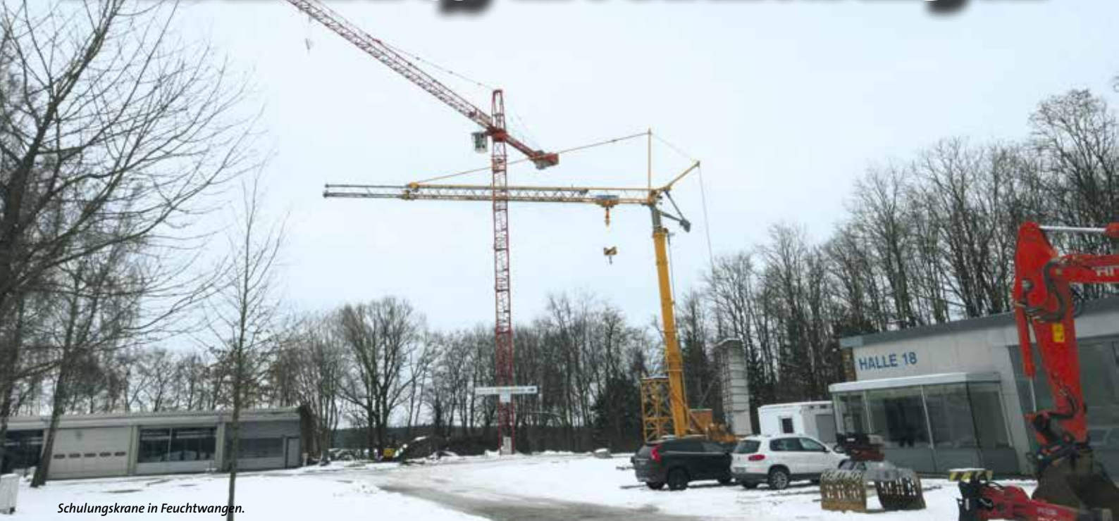
Schulungskrane in Feuchtwangen.

Gut 60 Brancheninsider trafen sich beim Branchentreff der TDK-Interessenvertretung in Feuchtwangen. Insgesamt zählte der Veranstalter an drei Branchentreffs 185 Teilnehmer. Sie werden ihre Teilnahme kaum bereut haben, denn wieder einmal ist es den Organisatoren gelungen, eine hochinteressante Fachveranstaltung zu organisieren.