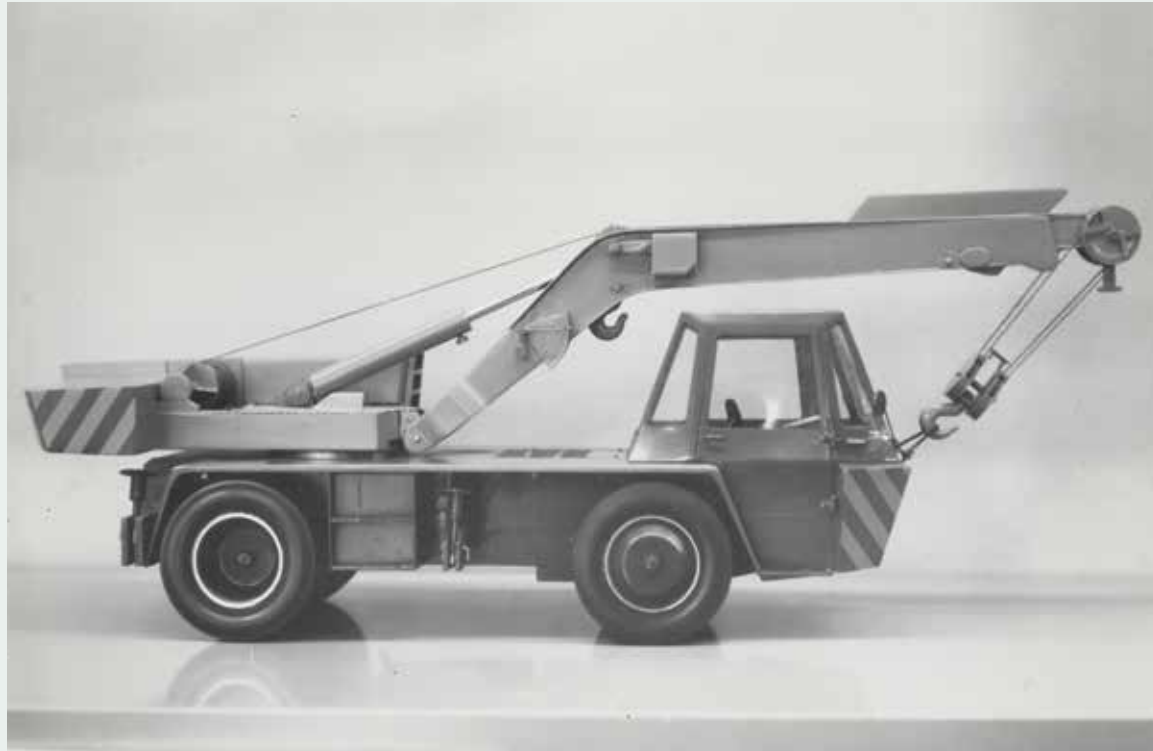
Modell im Maßstab 1:10 ...