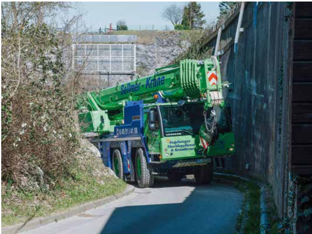
Der LTM 1090-4.2 meistert die enge Zufahrt zur Bad Segeberger Freilichtbühne.