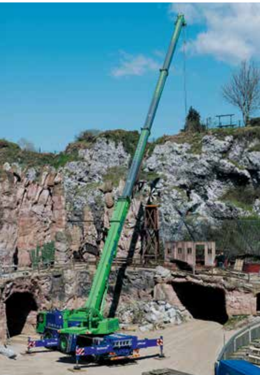
8,8 Tonnen Ballast waren ausreichend für die 3,5 Tonnen schweren Kulissen.