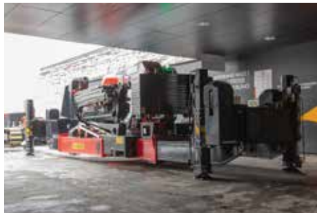
Getrennter Einmarsch von Kran und Raupenfahrwerk ... und gleich wieder mit dem Fahrwerk verbunden.

Durch den PALFINGER Raupenkran wird eine einfache Trennung von Kraneinheit und Raupenfahrwerk ermöglicht. So konnte der schwierige Zugang durch den niedrigen Stadioneingang bewältigt werden. Mittels eigener Stützausleger konnte er sich zudem schrittweise und optimal stabilisiert durch die engen Gänge hin zu seinen Einsatzpositionen „shiften“. Dort brillierte er, wieder mit dem Fahrwerk verbunden, gleich nochmals. Denn um beim präzisen Einsetzen der Betonelemente das erste Stadion-Obergeschoss nicht zu beschädigen, musste nach allen Seiten hin millimetergenau gearbeitet werden. Für den kompakten Kran kein Pro-