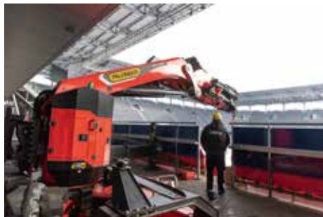
Der PCC 57.002 bei seinem Einsatz im Stadion von Salzburg.