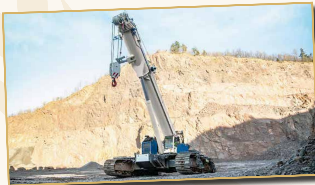
Der Sieger ist der Tadano GTC-2000