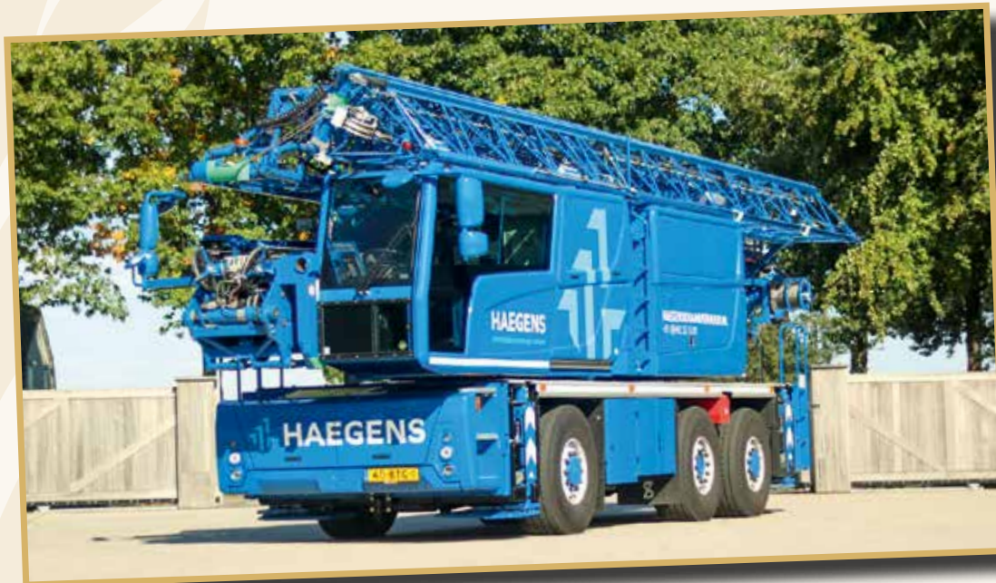
Der Sieger ist der Spierings SK487-AT3 City Boy