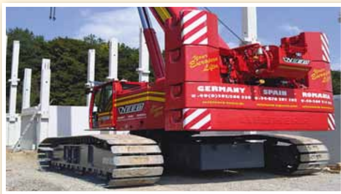
Geländetauglich und 100 t Tragkraft: Der LTR 1100 der Krandienstleisters Neeb ist als Hilfskran in der WEA-Montage ebenfalls einsetzbar.