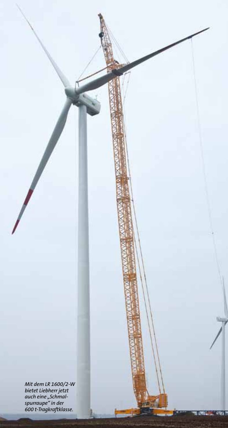
Mit dem LR 1600/2-W bietet Liebherr jetzt auch eine „Schmalspurraupe“ in der 600 t-Tragkraftklasse.