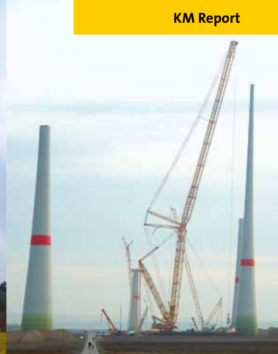
Mehr Hübe mehr Krane: Inzwischen kommen an einer WEA auch schon einmal mehr Krane als einer für die Montage und ein Hilfskran zum Einsatz. Eine sich abzeichnende Variante ist, dass ein „kleinerer“ Kran den Trum stellt und ein weiterer, tragkraftstärkerer Kran Gondel und Rotorstern. Allerdings gibt es auch WEA-Hersteller, die inzwischen die Stückgewichte unter 70 t deckeln, wodurch es möglich ist, wieder die komplette Anlage durch einen Kran zu stellen.

Rückbau alter WEA noch einmal zum Einsatz kommen könnte. Bis 1998 war der Transport und die Montage von WEA noch ein Fall für „Standardequipment“. Die Anlagen, die zum Beispiel noch 1997 installiert wurden, wiesen im Durchschnitt eine Leistung von wenig mehr als 600 kW auf. Bis dahin wurden viele WEA noch mit Teleskopkränen mit maximalen Tragfähigkeiten bis zu 400 t montiert, und der Transport der drei Rotorblätter erfolgte bis dahin zum Teil im Paket, also mit einer Transporteinheit.