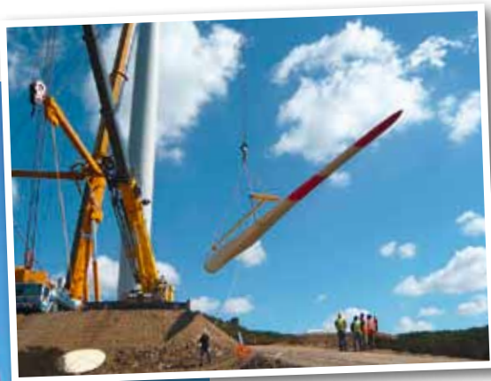
VarioBeam ... ... nennt Axzion die gemeinsam mit Nordex entwickelte Traverse zum „Aufstecken“ einzelner Rotorblätter auf die schon an die Gondel montierte Nabe. Dieses System bietet den Vorteil, dass noch bei recht hohen Windgeschwindigkeiten der Rotor montiert werden kann, während der Hub des am Boden vormontierten Rotorsterns mit Teleskopkränen nur bei einer Windgeschwindigkeit bis 6 m/s zulässig ist.

Noch ein weiterer Aspekt ist für den Trend zu geringeren