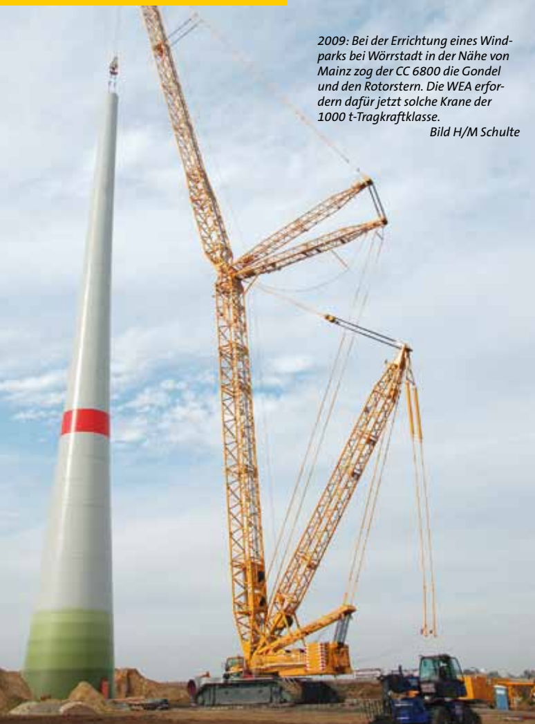
2009: Bei der Errichtung eines Windparks bei Wörrstadt in der Nähe von Mainz zog der CC 6800 die Gondel und den Rotorstern. Die WEA erfordern dafür jetzt solche Krane der 1000 t-Tragkraftklasse.