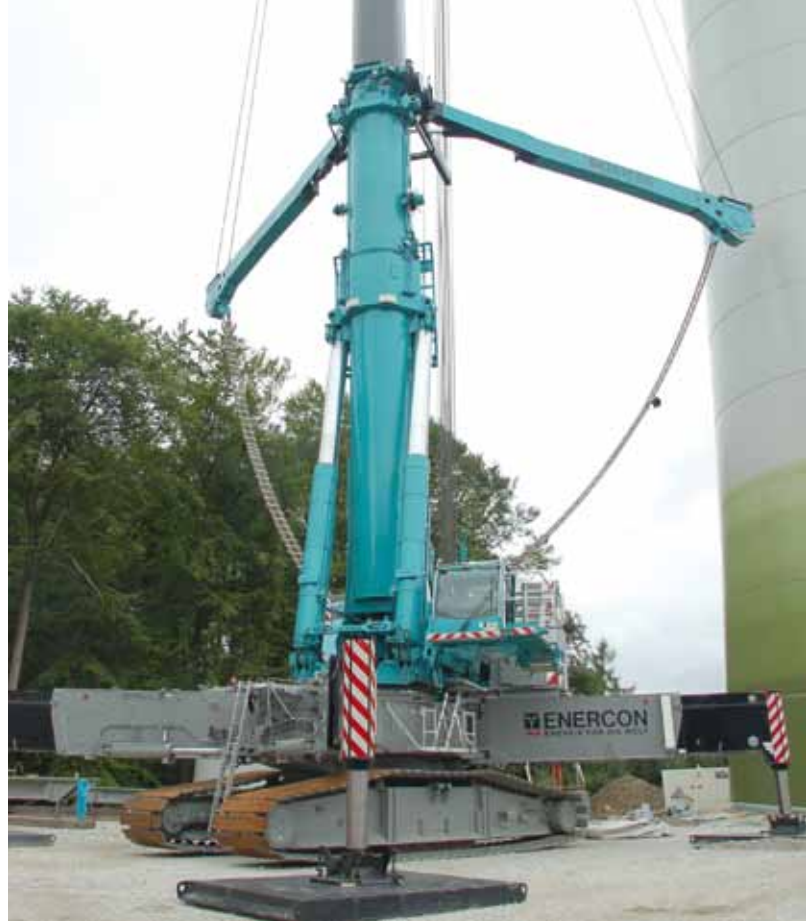
Für den 1.200 t-Teleskopkran hat Liebherr gleich zwei Varianten im Angebot: „Klassisch“ auf einem 9-achsigen AT-Fahrgestell und auf einem ultraschmalen Raupenfahrwerk. Die Tragkräfte am Teleskopausleger mit Windkraftausstattung reicht aus die Gondeln von 2 bis 3 MW-Anlagen zu heben.

noch mittels eigens entwickelter Trailer, die in diesem Jahr vorgestellt wurden, transportierbar sind. Die Rotoren haben damit Durchmesser und Gewichte erreicht, die – wie schon erwähnt – unter den windigen Bedingungen in Windparks schon bei etwa 65 t eine kritische Masse erreicht haben, so Andreas Petzold.