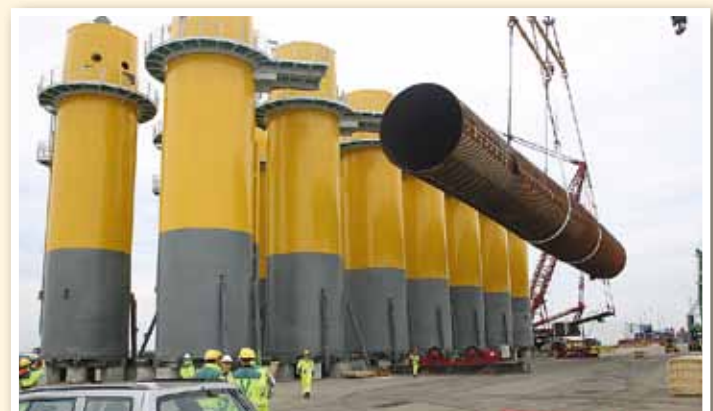
Heben eines 650 t schweren Monopfahls für Offshore-Windkraftanlagen mit zwei aus Dyneema gefertigten Schlingen. Die Verwendung von Dyneema, einer Faser aus Polyethylen ultrahoher Molmasse („UHMWPE-Faser“) verleiht den Schlingen ein niedriges Gewicht und eine hohe Belastbarkeit.

DSM Dyneema: Heutzutage werden gleichermaßen Stahlseilschlingen, PET-basierte Schlingen und solche eingesetzt, die aus Hochleistungsfasern wie Dyneema bestehen. Schlingen aus Dyneema werden für Einsätze im Windkraftsegment zunehmend in Form von Seilschlingen oder Rundschnur eingesetzt. Die Hersteller beziehungsweise Errichter von Windkraftanlagen suchen nach Hebelösungen, die einen Beitrag zu mehr Sicherheit und Gesundheit bieten und die eine einfachere und schnellere