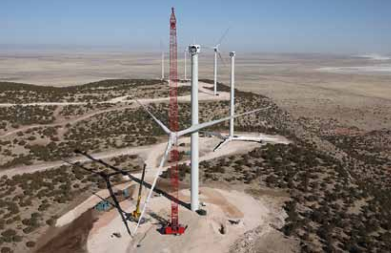
Das Model 16000 von Manitowoc in Windkraftausstattung in einem Windpark.

Gewicht im „Wind Energy Market 2007/2008“ mit 126 t angegeben wird.