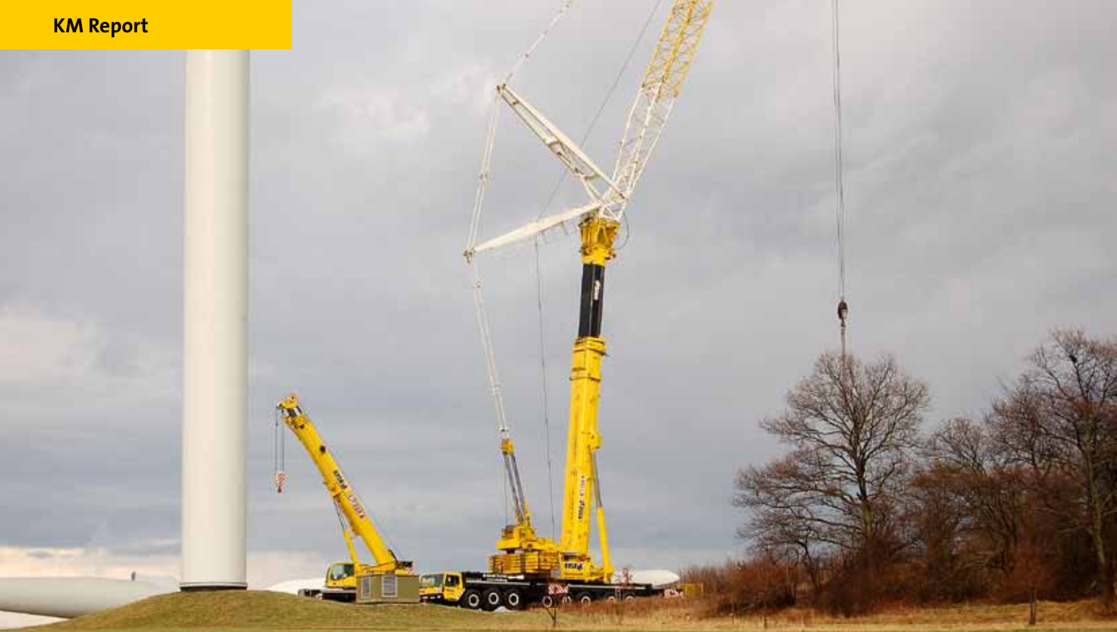
Ein 500-Tonner und sein „Gehilfe: Diese WEA ist für das Jahr 2006, dem Jahr dieses Einsatzes, nicht unbedingt repräsentativ. Der LTM 1500 kommt ohne Y-Abspannung zum Einsatz. Für eine durchschnittliche Anlage hätte 2006 schon kein Teleskopkran der 500 t-Klasse mehr ausgereicht, schon gar nicht ohne Auslegerabspannung.