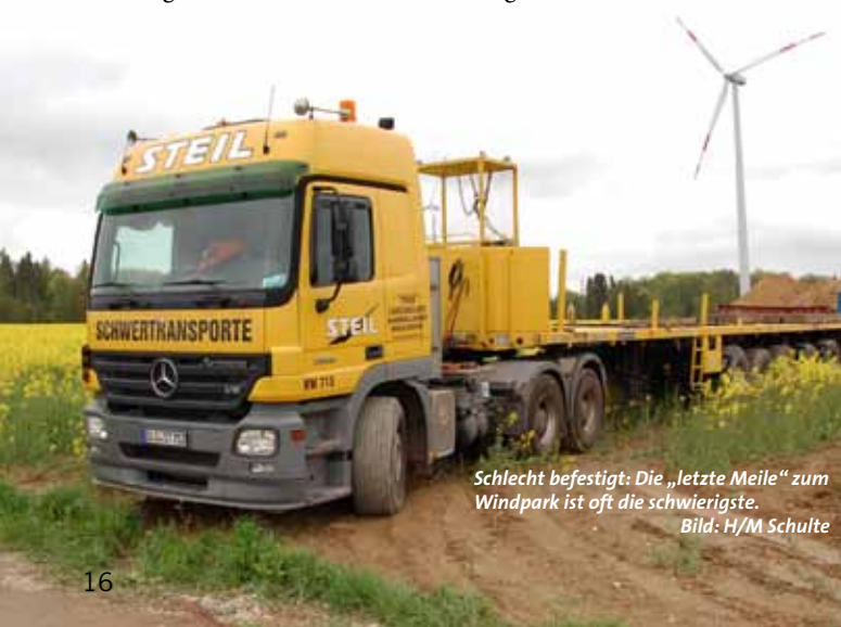
Schlecht befestigt: Die „letzte Meile“ zum Windpark ist oft die schwierigste.

Der Gesetzgeber hat also gleich zwei Instrumente geschaffen, die einen Anreiz für die Erneuerung von Altanlagen geben. Damit tritt die Windkraft in Deutschland beinahe unbemerkt von der Öffentlichkeit in eine neue Ära. Der deutsche Markt ist