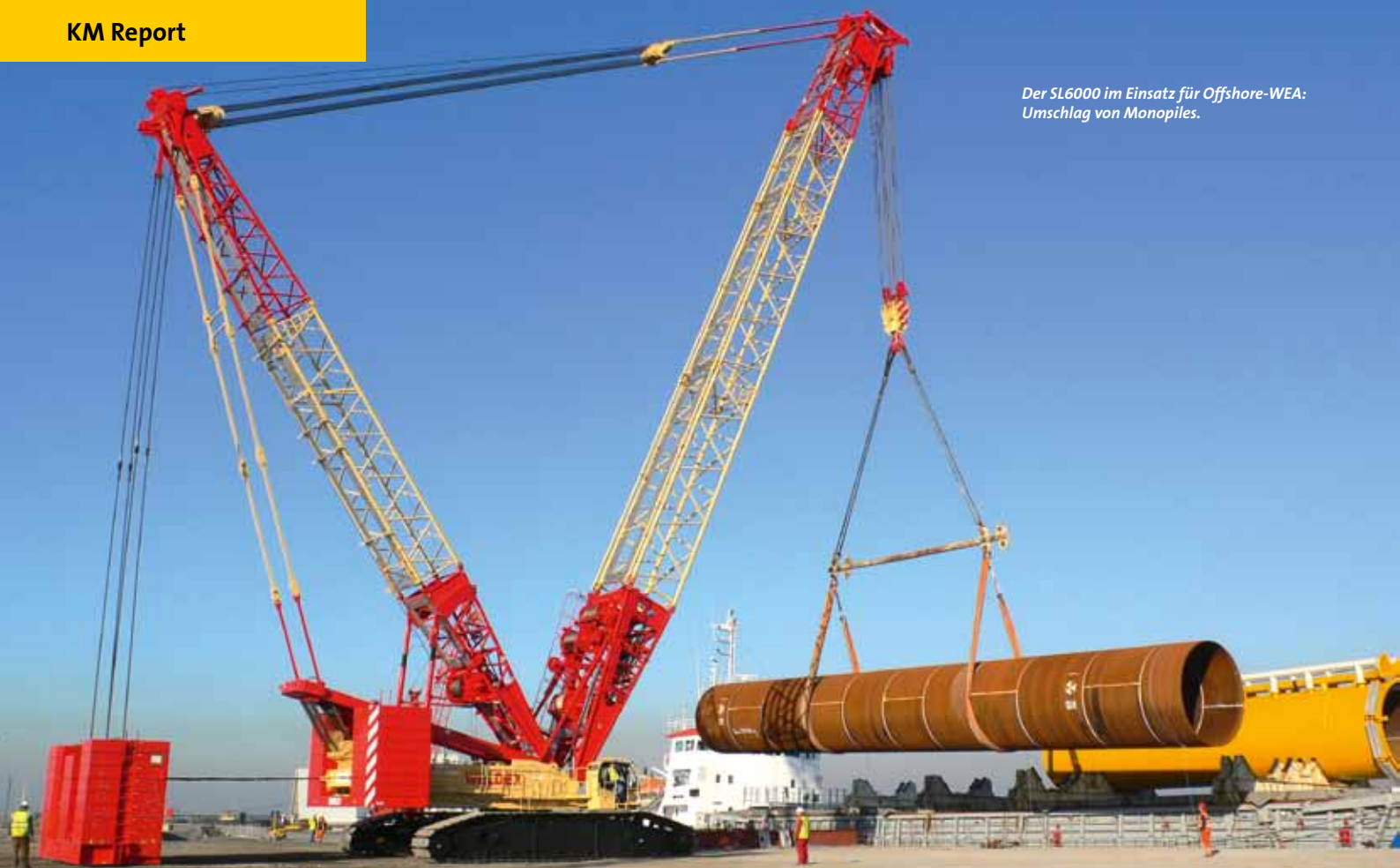
Der SL6000 im Einsatz für Offshore-WEA: Umschlag von Monopiles.

Ein Teil dieses Kapazitätswachses – nämlich 10 GW bis 2020 und 25 GW bis 2030 – sollen Offshore-Windparks erbringen.