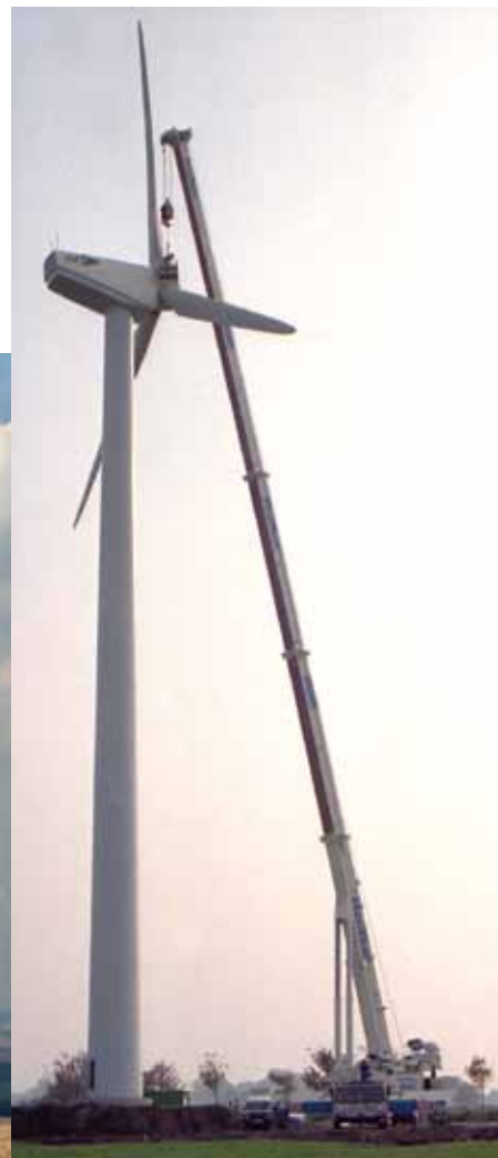
Diese Bilder entstanden Mitte / Ende der 1990er Jahre: Der große Windenergieboom stand erst noch bevor. Spezielles Windkraftequipment für Krane war noch garnicht vorhanden und ein einzelner 300-Tonner reichte manchmal noch aus um im Alleingang eine WEA zu stellen.

riskiert vom Wahlvolk abgestraft zu werden. Auf der anderen Seite hat sich Deutschland zugleich zu einer Reduzierung des CO 2 -Ausstoßes verpflichtet, was eine Erhöhung des Stromanteils aus fossilen Energieträgern wie Kohle und Gas ausschließt. Es sei denn, die im Schnitt rund 30 Jah-