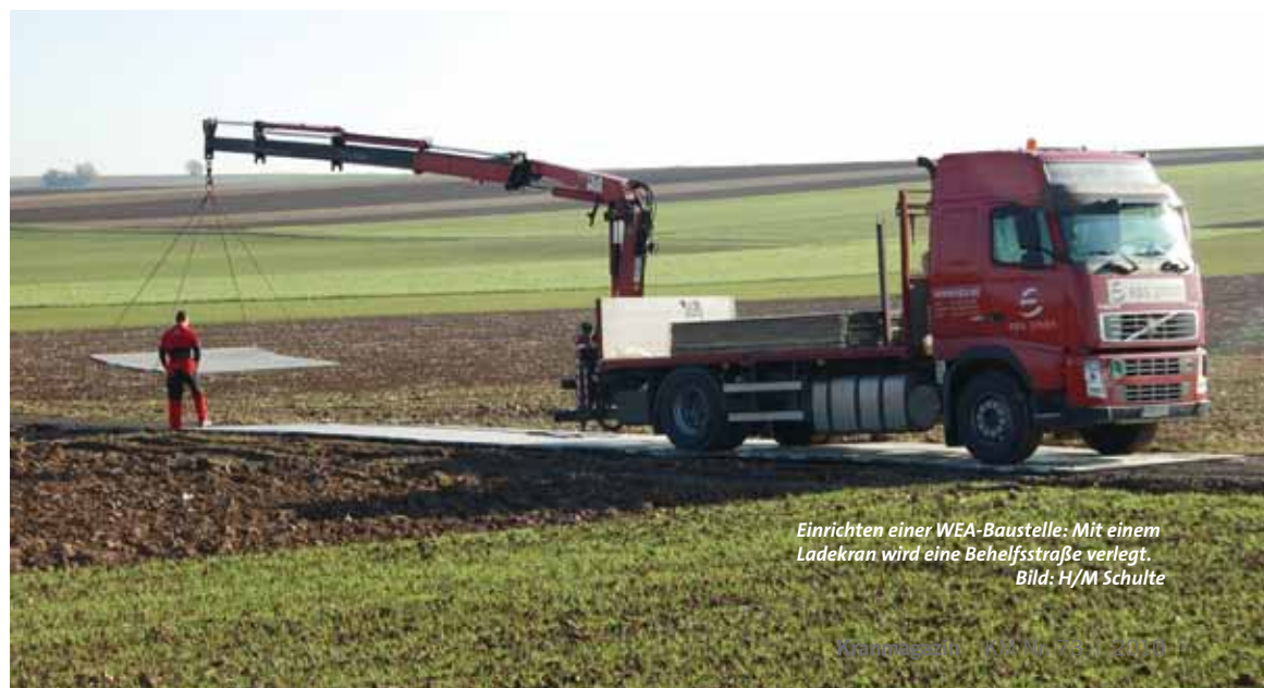
Einrichten einer WEA-Baustelle: Mit einem Ladekran wird eine Behelfsstraße verlegt.

Ganz so einfach allerdings, wie sich „Repowering“ anhört, ist es natürlich auch dabei nicht. Mit dem Rückbau der Bestandsanlagen und dem Neubau der modernen WEA ist es eben nicht getan. Die größere Stromkapazität macht es oft erforderlich, neue Stromtrassen zu geeigneten Einspeisepunkten zu legen. Und