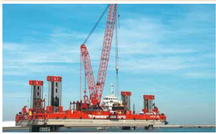
Mit „Jumping Jack“ installierte Mammoet van Oord Offshore-Anlagen. Zum Einsatz kamen dabei Ultralift-Schlingen von Dyneema.

DSM Dyneema: Ja, sehr sogar. Unsere Schlingen überzeugen eben durch die oben genannten Vorteile.