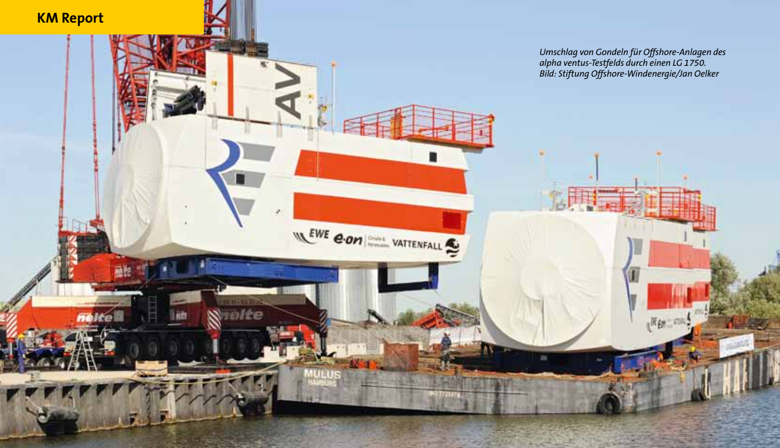
Umschlag von Gondeln für Offshore-Anlagen des alpha ventus-Testfelds durch einen LG 1750.

Deutschland zum großen Teil erschlossen sind, beschreibt der Zuwachs also im Wesentlichen das Repowering-Potenzial.