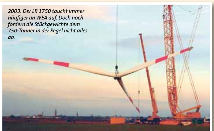
2003: Der LR 1750 taucht immer häufiger an WEA auf. Doch noch fordern die Stückgewichte dem 750-Tonner in der Regel nicht alles ab.

Dirk Bracht: Das Repowering befindet sich momentan zwar noch in der Anlaufphase, aber in diesem Bereich ist noch ein großes Potenzial vorhanden.