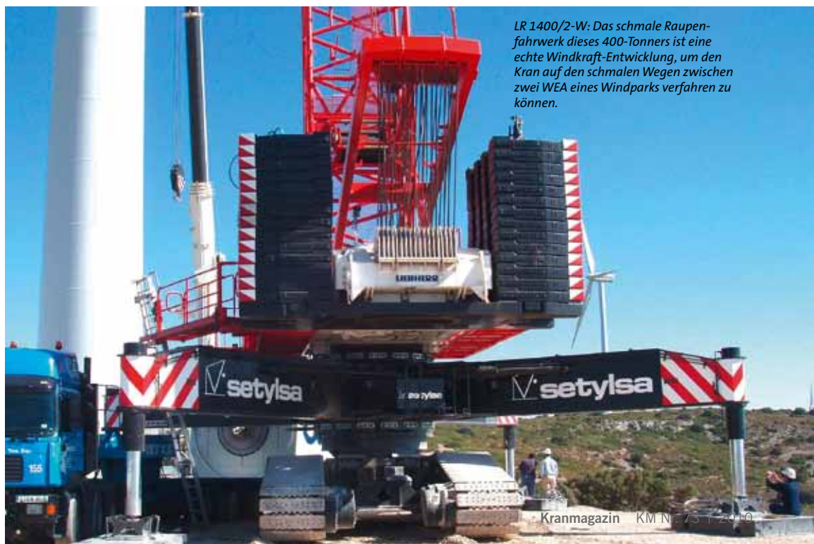
LR 1400/2-W: Das schmale Raupenfahrwerk dieses 400-Tonnners ist eine echte Windkraft-Entwicklung, um den Kran auf den schmalen Wegen zwischen zwei WEA eines Windparks verfahren zu können.

Selbst wenn davon auszugehen ist, dass die Offshore-Anlagen in dieser Zeit ebenfalls leistungsstärker werden, bedeutet dies, dass gut 1.500 Anlagen errichtet werden müssen. Doch wie viele Schiffe beziehungsweise Errichtungsplattformen mit entsprechenden Krankapazitäten und der Fähigkeit, sich in 40 m Wassertiefe abzustützen, sind überhaupt verfügbar?