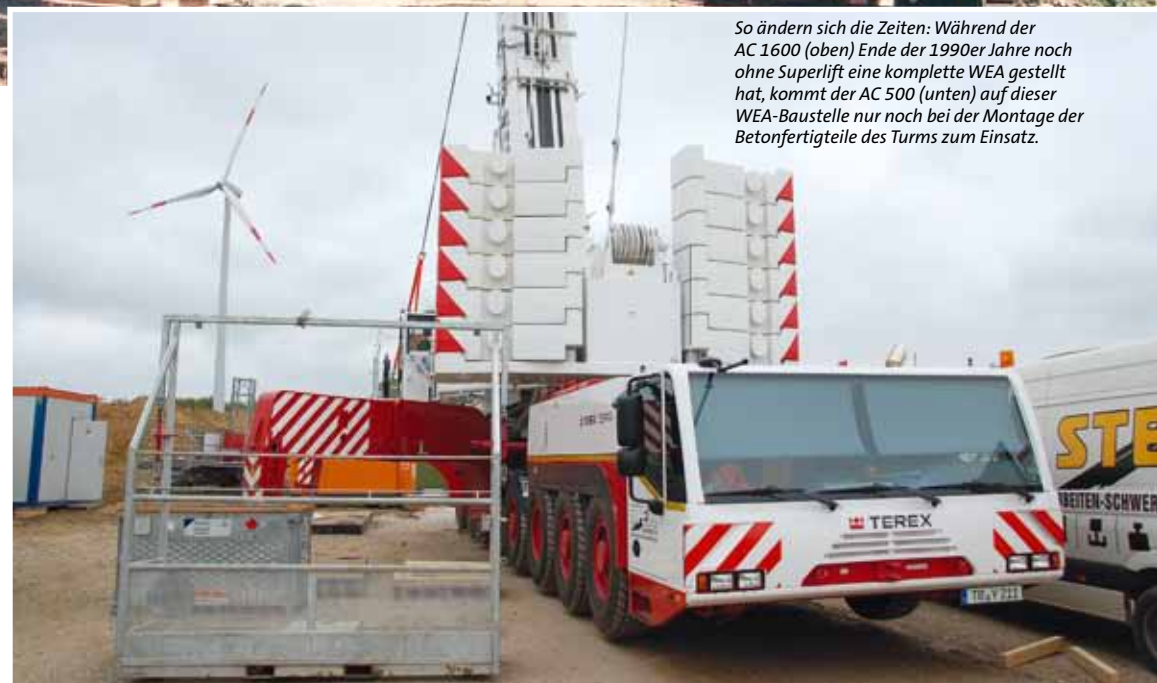
So ändern sich die Zeiten: Während der AC 1600 (oben) Ende der 1990er Jahre noch ohne Superlift eine komplette WEA gestellt hat, kommt der AC 500 (unten) auf dieser WEA-Baustelle nur noch bei der Montage der Betonfertigteile des Turms zum Einsatz.