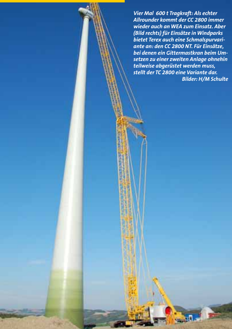
Vier Mal 600 t Tragkraft: Als echter Allrounder kommt der CC 2800 immer wieder auch an WEA zum Einsatz. Aber (Bild rechts) für Einsätze in Windparks bietet Terex auch eine Schmalspurvariante an: den CC 2800 NT. Für Einsätze, bei denen ein Gittermastkran beim Umsetzen zu einer zweiten Anlage ohnehin teilweise abgerüstet werden muss, stellt der TC 2800 eine Variante dar.