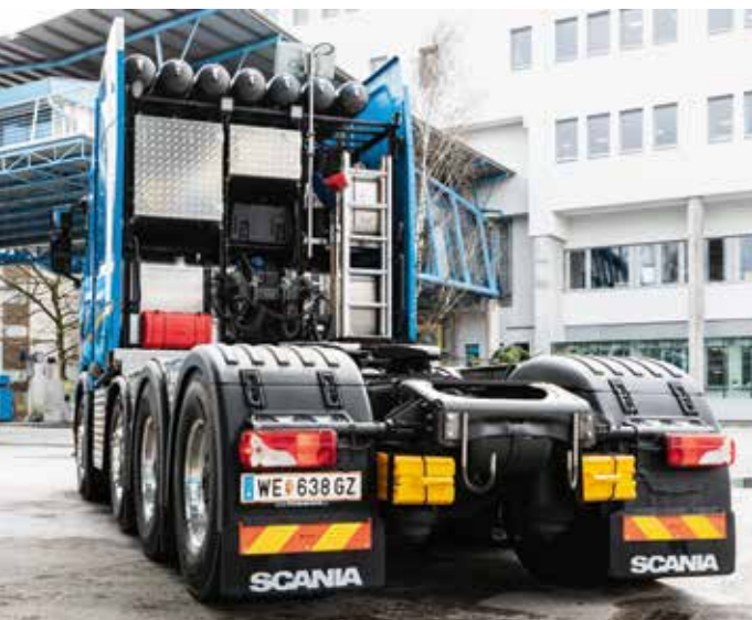
Bei Felbermayr erfolgen noch spezielle Einbauten.