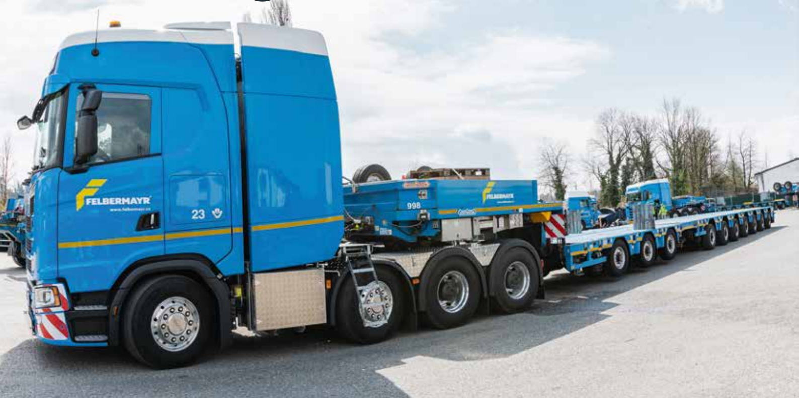
Neu im Fuhrpark von Felbermayr: der Scania 770S.

Mit dem 770 PS starken Scania 770S hat die Felbermayr Transport- und Hebetchnik GmbH & Co KG im Juni 2021 eine Weltpremiere in den Fuhrpark übernommen. Für die schwierigsten Aufgaben des Transportgewerbes setzt der weltweit renommierte Spezialist für Schwer- und Sondertransporte auf die legendäre Kraft des Scania V8-Motors.