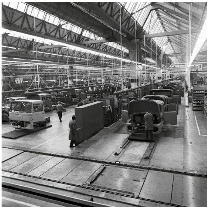
Am 1.10.1963 lief der erste Fahrerhaus-Rohbau vom Band.