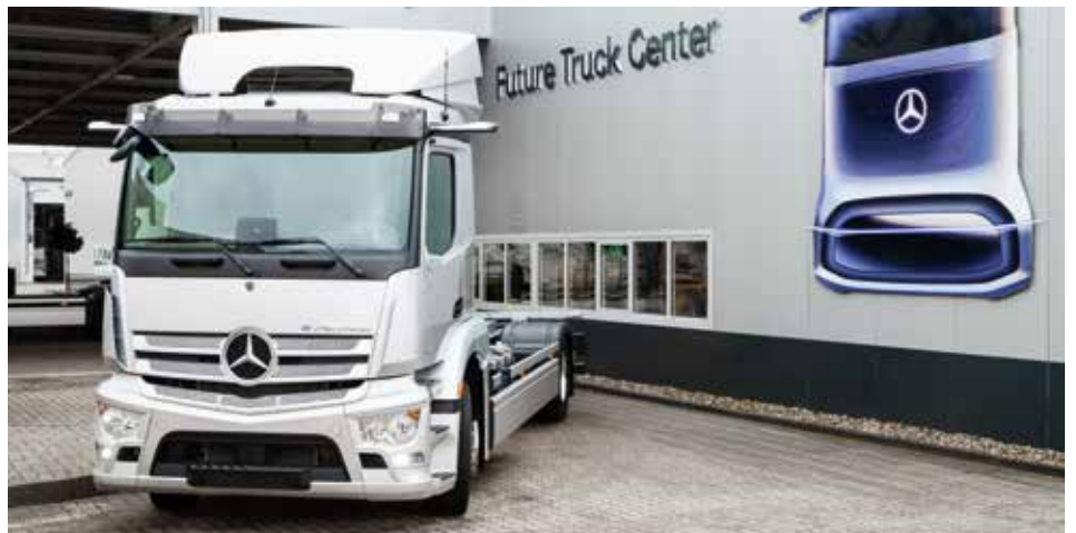
Future Truck Center im Mercedes-Benz Werk Wörth.

und den gestalten wir zusammen. Dank neuer Produkte entstehen auch neue Berufsbilder für die Kolleginnen und Kollegen und damit neue berufliche Chancen. Als Leitplanke dient uns das starke und tragfähige Zukunftsbild für den Standort, welches wir im Jahr 2021 mit der Unternehmensleitung vereinbart haben.“