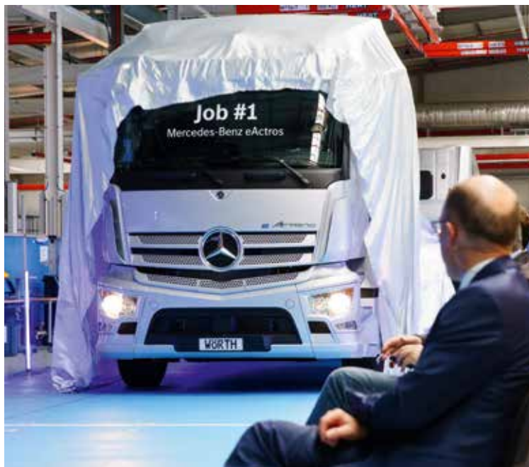
Der erste Serien-eActros lief am 7. Oktober 2021 im neuen Future Truck Center des Mercedes-Benz Werks Wörth vom Band.