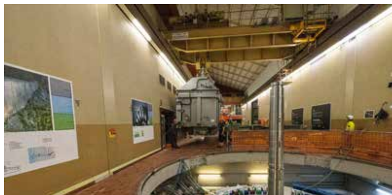
Der Transformator schwebt am Hallenkran hängend zu seinem neuen Bestimmungsort.