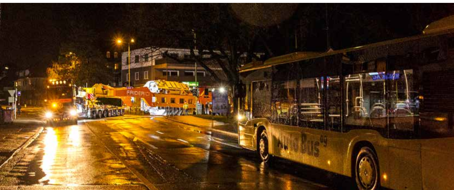
Auch der ÖPNV muss einen Augenblick warten.