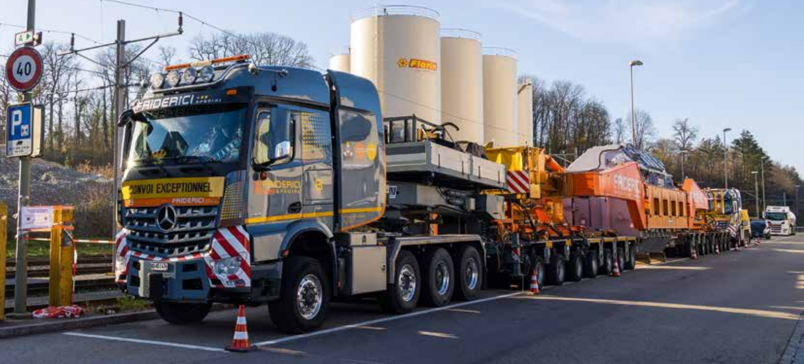
Abfahrbereit im Hafen.

Erneuerbare Energie ist in aller Munde, meistens wird damit Wind- und Sonne gemeint. Eine sogenannte alte Energieform, welche in der Schweiz weitverbreitet ist, ist die Wasserkraft. Allerdings sind die Wasserkraftanlagen meist schon vor langer Zeit gebaut worden.