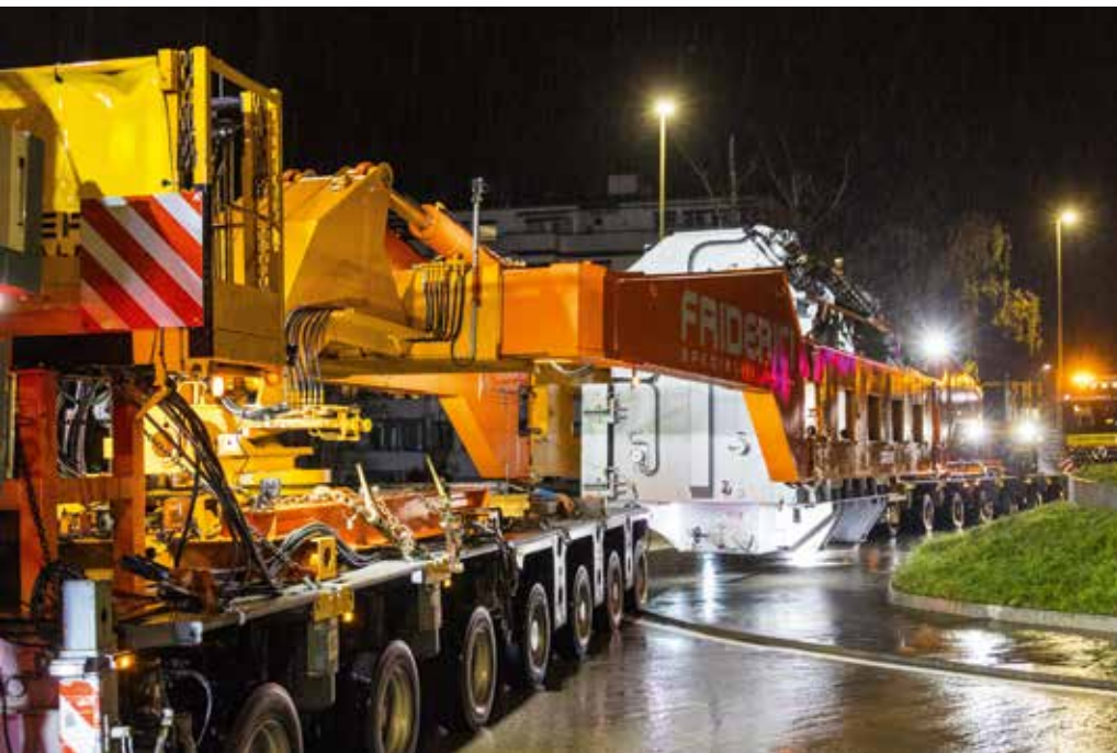
Der Zug meistert den letzten Kreisverkehr in Pratteln, welcher genügend Platz bietet.

sen die Drehschemel der Brücke aufnehmen. Dazu wurde ein Liebherr LTM 1300 ins Wallis geschickt, mit dem die Achsen ausgebaut und die Drehschemel versetzt werden konnten. Ebenso mussten die Drehschemel außermittig versetzt werden, damit nichts an den Wänden des Zugangsstollens streifte. Hierzu waren im Vorfeld aufwendige 3D-Messungen notwendig, um den Transport zu simulieren und ebenso die maximalen Abmessungen des Trafokessels herauszufinden, sodass SIEMENS Energy diesen entsprechend der Zugänglichkeit bauen konnte. Der Schwerpunkt der Ladung durfte beim außermittigen Transport auch nicht außer Acht gelassen werden, damit der Transport nicht umkippte.