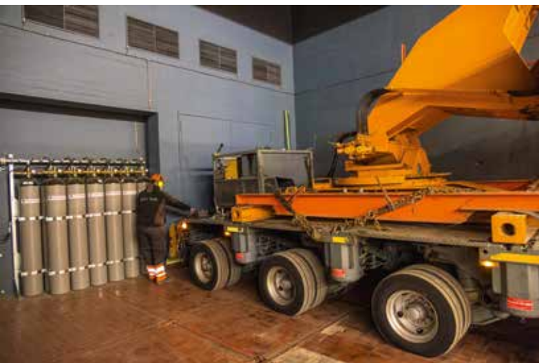
Jeder Zentimeter wird am Abladeort ausgenutzt.