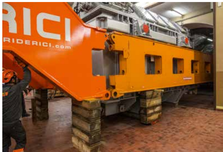
Die Seitenträger werden getrennt.