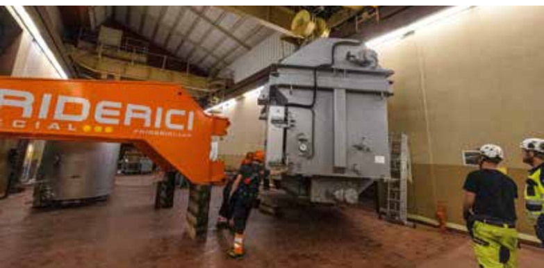
Nachdem der Transformator ausgedreht wurde, kann der Kran mit seiner Last wegfahren.