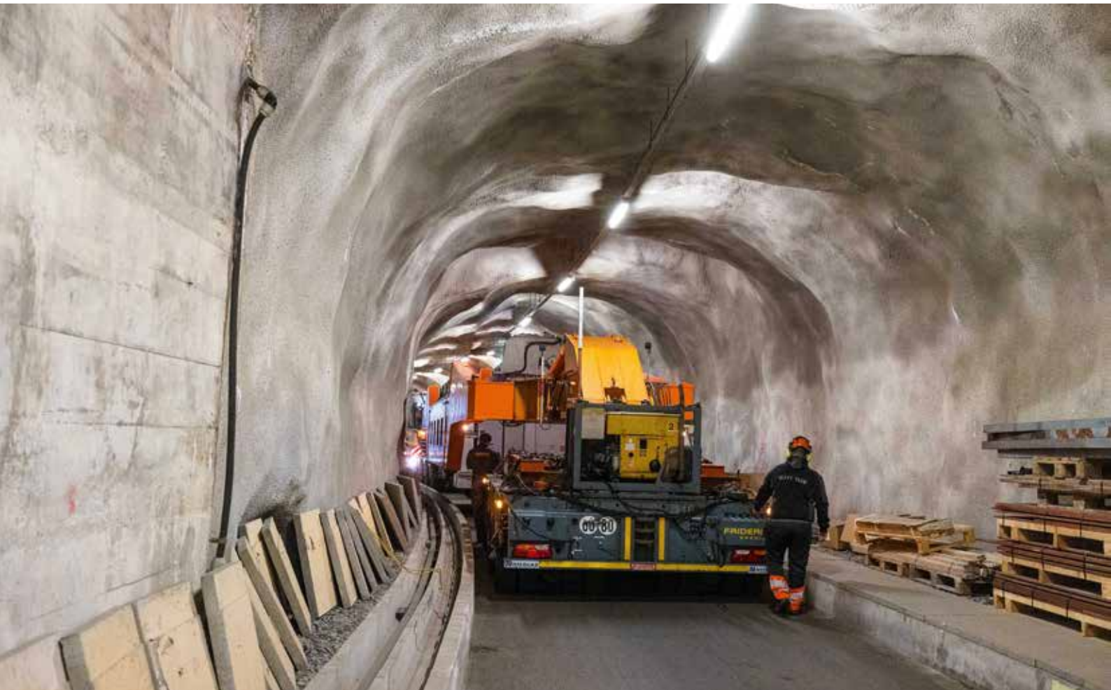
Der Zugangsstollen lässt seitlich und nach oben gerade genügend Platz.