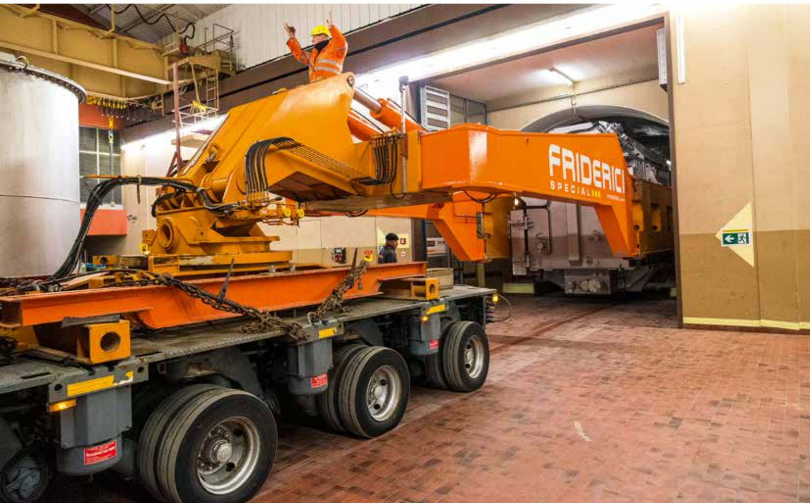
Der Zielpunkt ist fast erreicht.