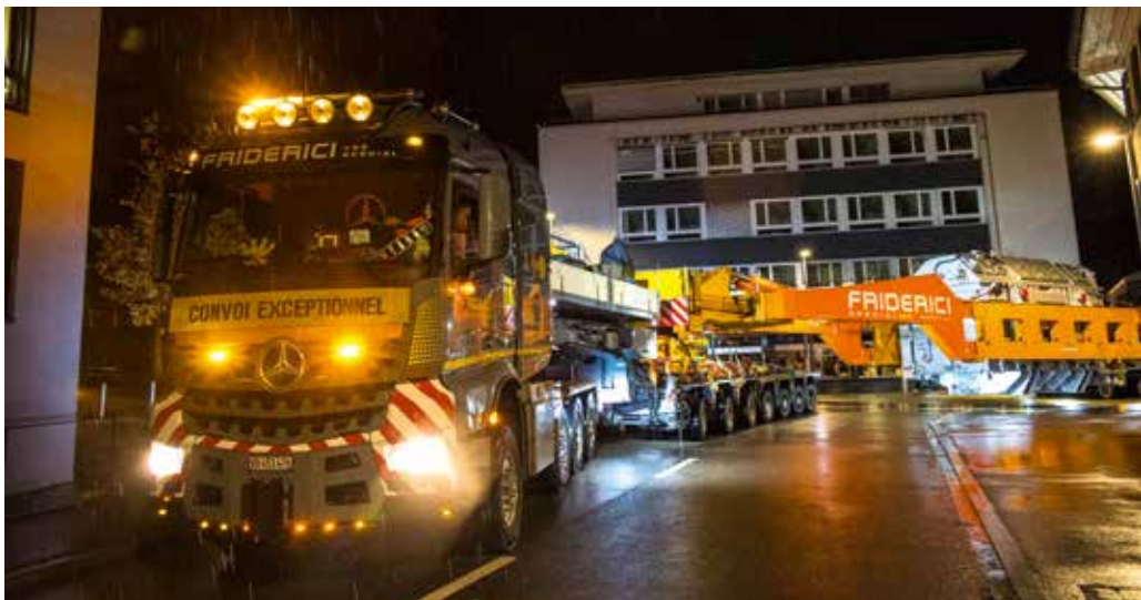
In Liestal geht es mit dem relativ kurzen Transport gut durch den Flaschenhals.

Umbauaktion wurde der Transport über das Wochenende im Zugangsstollen der Kaverne geparkt. Am Montag wurde dann das ganze Gespann durch den Zugangsstollen in die Kaverne gestoßen, wobei zu beachten war, dass die Achsen bis fast ganz an die Rückwand geschoben werden mussten, damit der Transformator mit dem Hallenkran angehoben werden konnte. Dazu wurde der Trafo mittels der Fahrzeughydraulik abgesetzt und dann nochmals außermittig angehoben, sodass er noch etwas weiter in die Kaverne gelangte. Anschließend wurde die Seitenträgerbrücke aufgemacht, damit der Transformator abgedreht werden konnte. In einem Hub, welcher die volle Konzentration des Kranführers benötigte, wurde der Transformator anschließend vor den Zugang zum endgültigen Standort gehoben. Hier konnte er anschließend via Seilzugsapparat eingebracht werden.