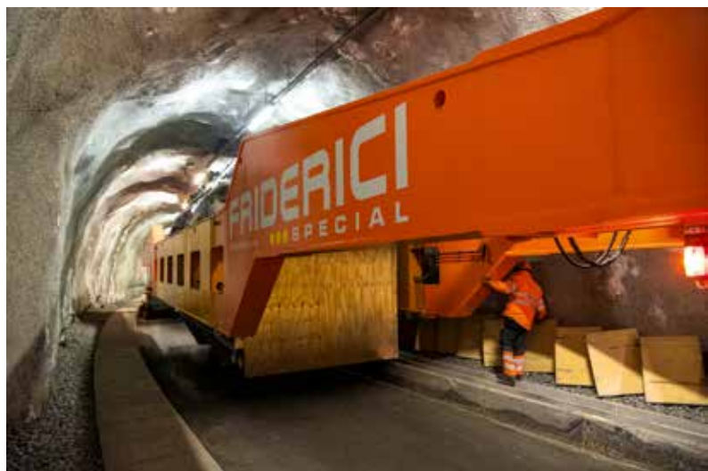
Durch diese Kurve muss es gehen.