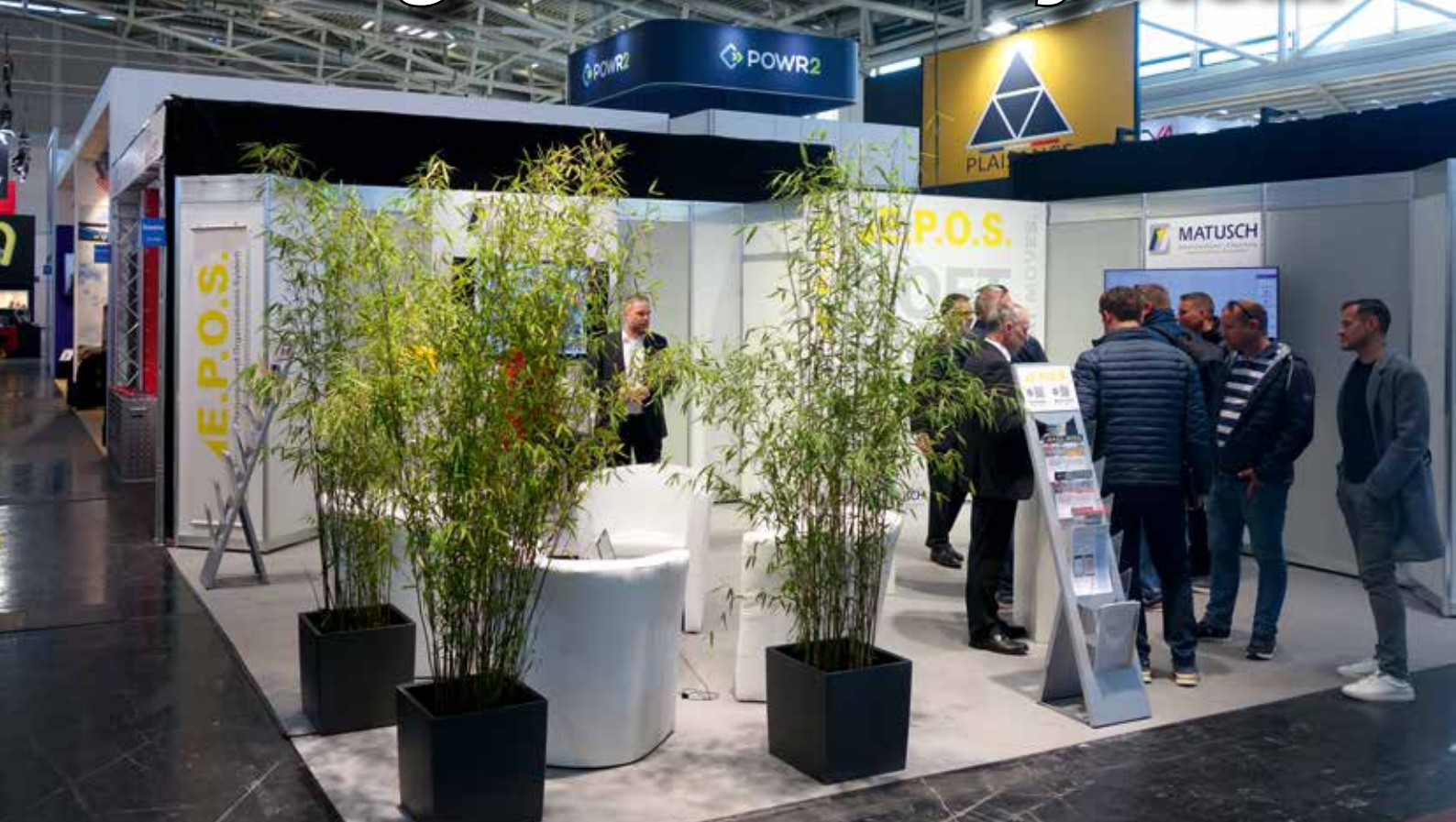
Der Stand der Matusch GmbH auf der diesjährigen bauma.