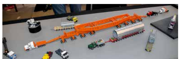
So sehen dann wohl Schwertransporte in Amerika aus.