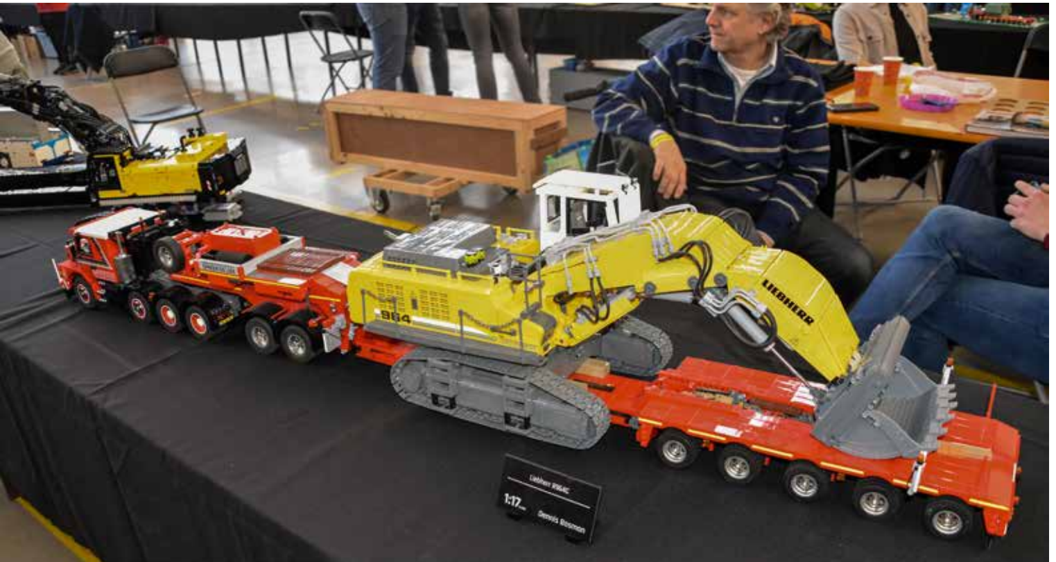
Neben der 3D-Druck-Fraktion existiert zudem noch die LEGO-Fraktion.