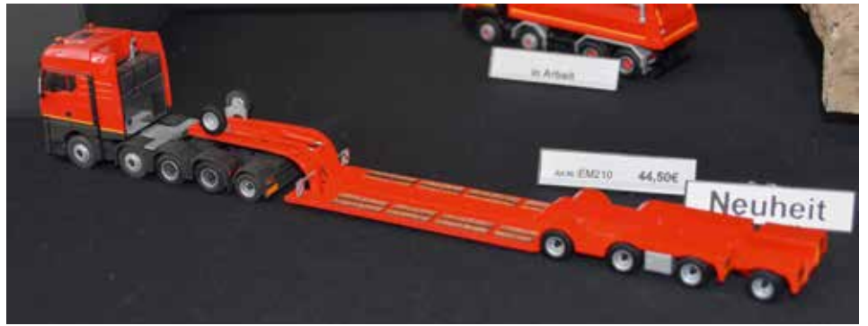
Modelle im 3D-Druck erobern die Szene.