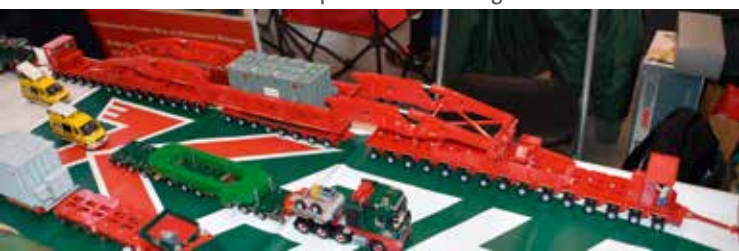
Bei diesem Schwertransport kommen eine schier unzählbare Menge an Achslinien zum Einsatz.