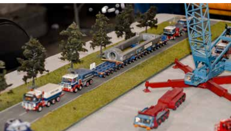
Ein deutscher Schwertransport aus älteren Tagen.