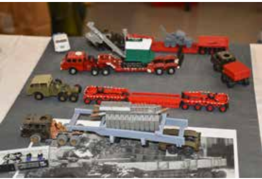
Amerikanisch deutsche Historie im Modellbau.