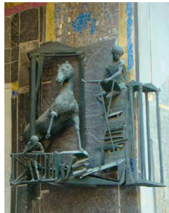
Der Amtsschimmel von Blasius am Heilbronner Rathaus zeigt deutlich die Abwehrhaltung des Betroffenen gegenüber der Obrigkeit. Bürokratieabbau sieht anders aus.

Autsch, dem begnadeten Vielschreiber und Wortklaubler stellt sich hier die alles entscheidende Frage: Was bedeutet baugleich??? Denn der Begriff sorgt offenbar für Verwirrung. So