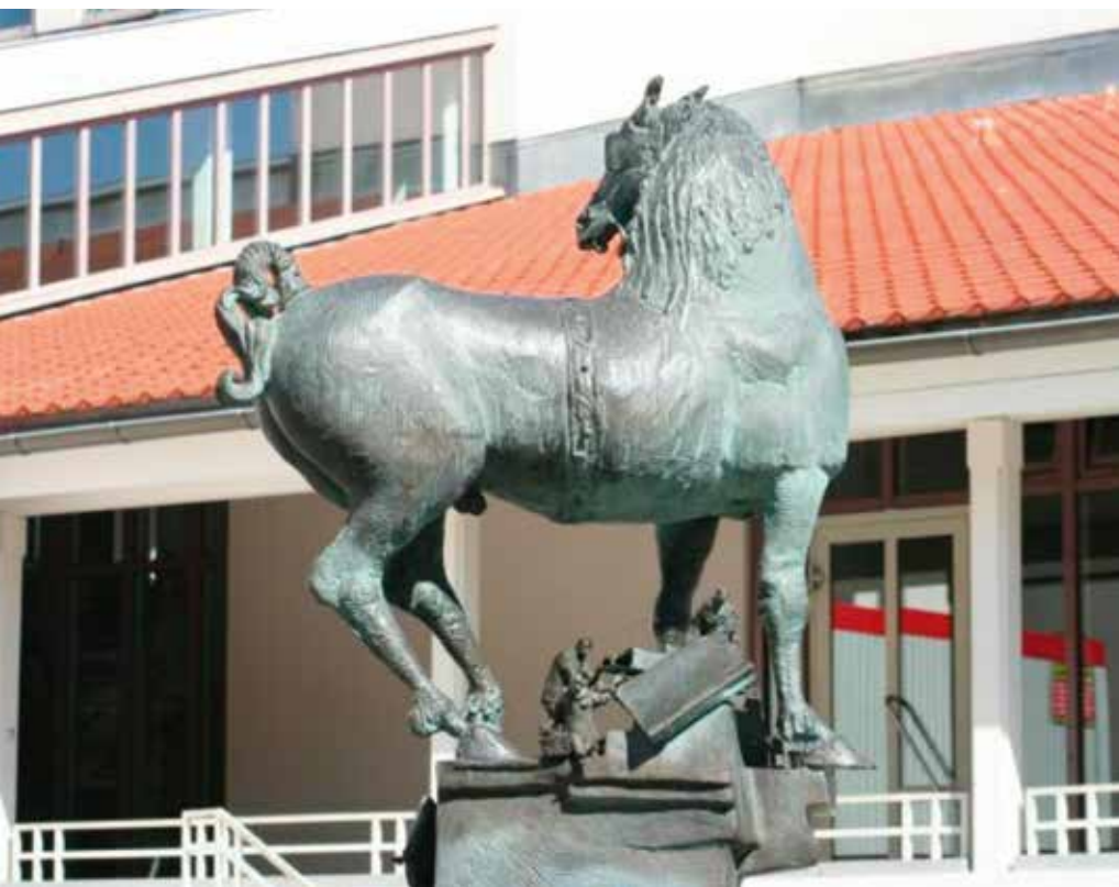
Der Amtsschimmel in Dingolfing zeigt eine ähnliche Unterwerfungshaltung.