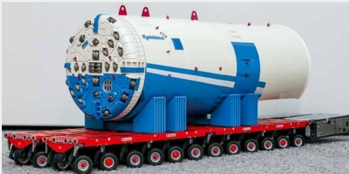
Neu von IMC Models: Scheuerle SPMT im Maßstab 1:50.