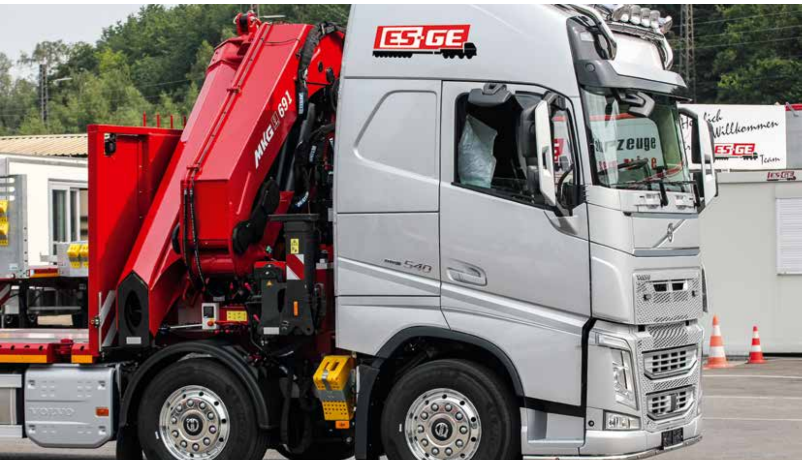
Der MKG-Ladekran HLK 691SHP a6 wurde hinter dem Führerhaus platziert.