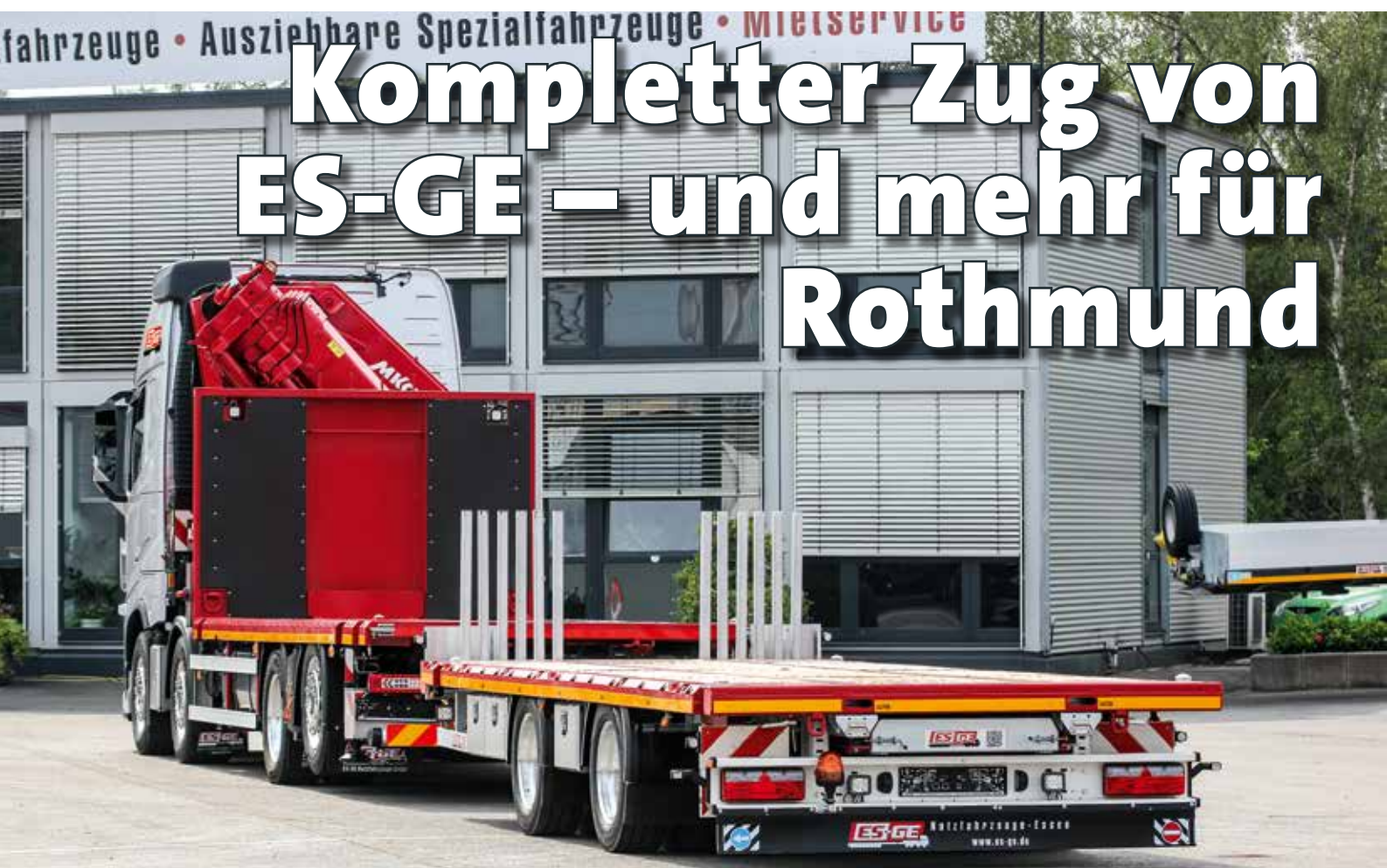
Eine besondere Sattelzug-Ladekran-Kombination realisierte ES-GE für die Rothmund GmbH.

Heben und bewegen – was zunächst nach einem Kurs im Fitness-Studio klingt, ist das Motto der Rothmund GmbH – und das seit mittlerweile fast 40 Jahren. Wer auf dem hart umkämpften Markt mithalten und die wachsenden Ansprüche an Mensch und Maschine stemmen möchte, muss sich tatsächlich fit halten.