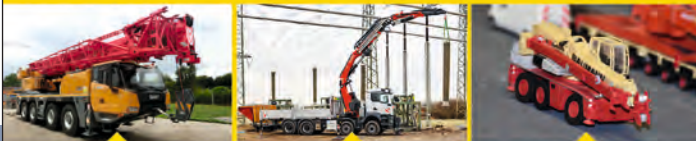
MARKT & MARKEN: SANY SAC700E ZUM TEST IN AKTION: FASSI FB20RA.2.26 KMI MINI: MINI IN MAINZ