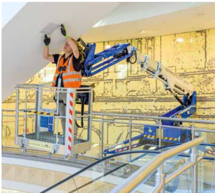
Mit dem neuen Ruthmann Bluelift SA 11 P können die Leuchtmittel über den Rolltreppen am Limbecker Platz problemlos ausgetauscht werden.

Unter Begleitung der Haustechnik geht es auf den abrieffreien Gummiketten ins Innere des Gebäudes. Vereinzelte Passanten,