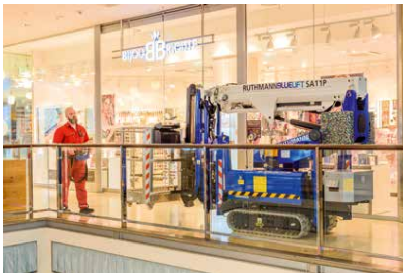
Auf den hellen, abrieffreien Gummiketten geht es mit der SA 11 P durch das Gebäude zum Einsatzort.