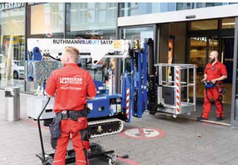
Die Haustechnik vom Limbecker Platz nimmt die Ruthmann Bluelift Raupenarbeitsbühne in Empfang.

Mit einem Handgriff ist der Arbeitskorb der Maschine de-