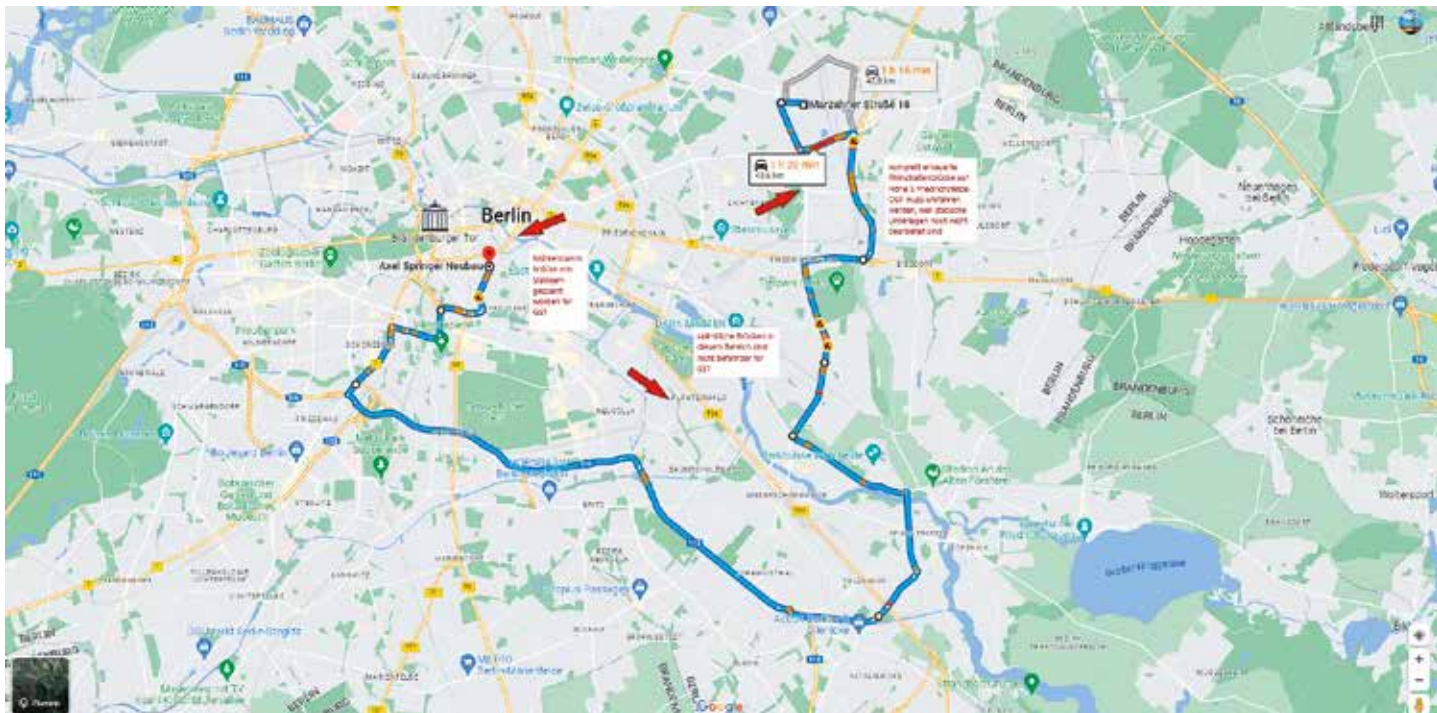
Realität – wesentlich länger und deutliche Umfahrung wegen GST-Auflagen.